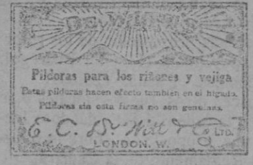
La caja mágica azul y oro

Holandeses, boers, franceses, etc., todos saben que es el único remedio seguro para las dolencias de los riñones. En el Canadá y América, millones son los que continuamente lo recomiendan, y ya en España su venta va aumentando enormemente. El remedio seguro que emplean es Píldoras De Witt para los Riñones y la Vejiga.