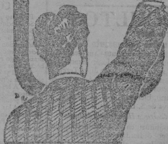
FIGURA DE FARMACIAS Y DROGUERIAS

y los Médicos le llaman el REMEDIO DE LOS DÉBILES