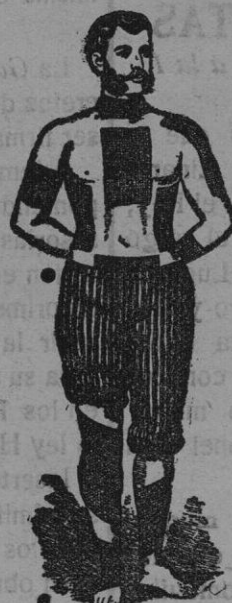
Los emplastos de feltro rojo, del Dr. Winter, son los únicos verdaderos y eficaces.—Cuidado con las imitaciones.—Exíjase siempre la marca del Dr. Winter.—Cura como por encanto.—Boticas y Droguerías

Curan reumatismo, resfriados, dolor de riñones, dolor de espalda, dolor de pulmones, lumbago, clática, contusiones, etcétera, etc.