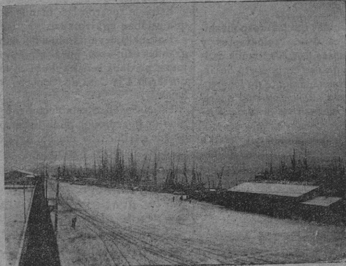
La explanada del Muelle