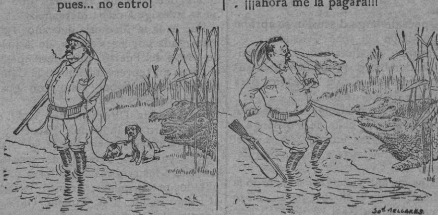
AVENTURA DE CAZA.

Era... voto á Barrabás un busto, y sufrí por él una noche tan crue! ¡¡ahora me la pagará!!!