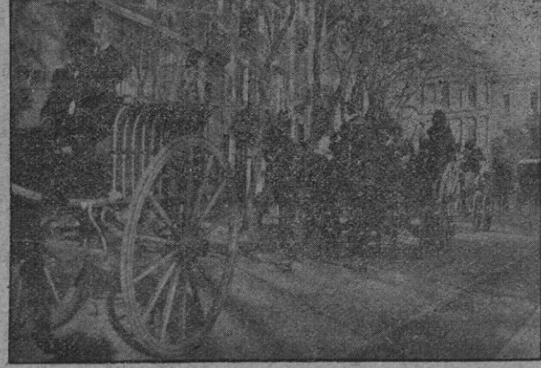
Fragmento del desfile