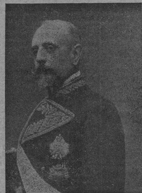
D. Laureano Irazabal Echevarria Gobernador civil de Baleares