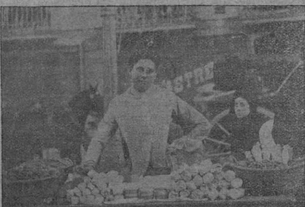
Vendedora de confetti