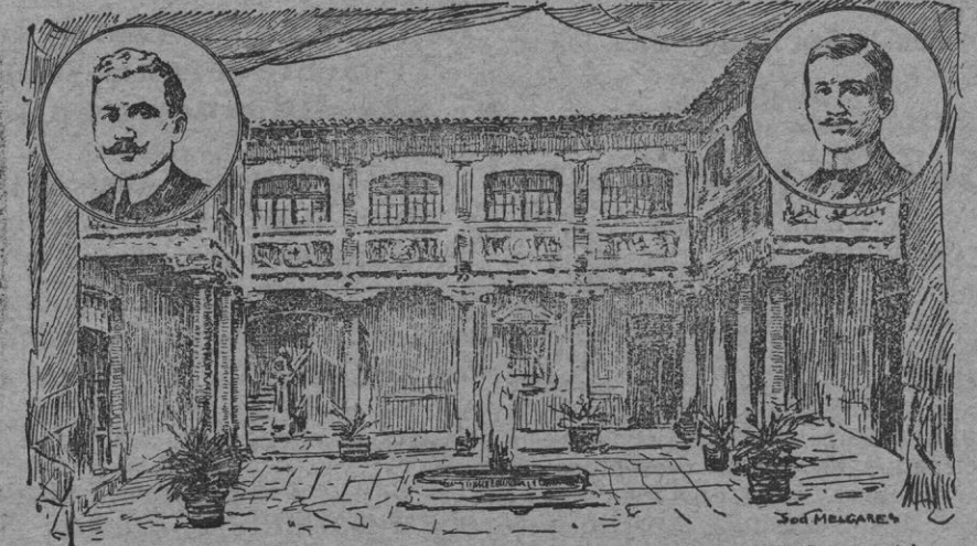
Los hermanos Quintero.—Decoración del primer acto de «El Genio Alegre»