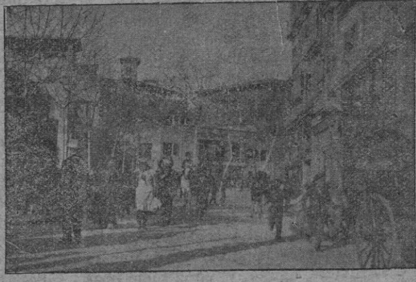
Grupo de máscaras