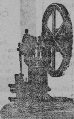
Modelo DV vertical de 1/2 á 8 caballos. Modelo EV horizontal de 1/2 á 200 caballos.

Para más informes dirigirse á la Sucursal Gasmotoren Fabrik-Deutz, -Ronda de S. Pedro número 8, Barcelona.