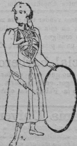
Vestido para niñas de 8 á 10 años

Las mangas, como las anteriormente descritas, son anchas en la parte superior y ajustadas en la parte inferior; y el cuello alto y vuelto, se hace como las solapas de terciopelo epingle .