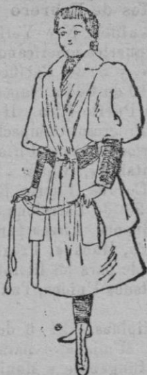
Vestido para niñas de 10 á 12 años

La espalda forma un gran pliegue Watteau que cae terminando en cola, y las mangas anchas effiense al puño por vueltas de terciopelo color ciruela. El cuello y los delanteros van guarnecidos de piel de nutria ó de pluma.