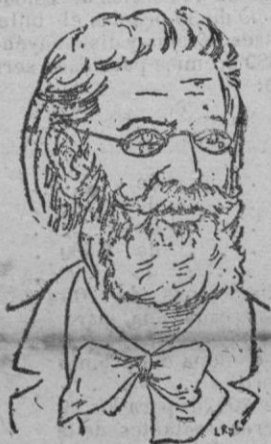
Mr. Drumont, (Director de La Libre Palabra)