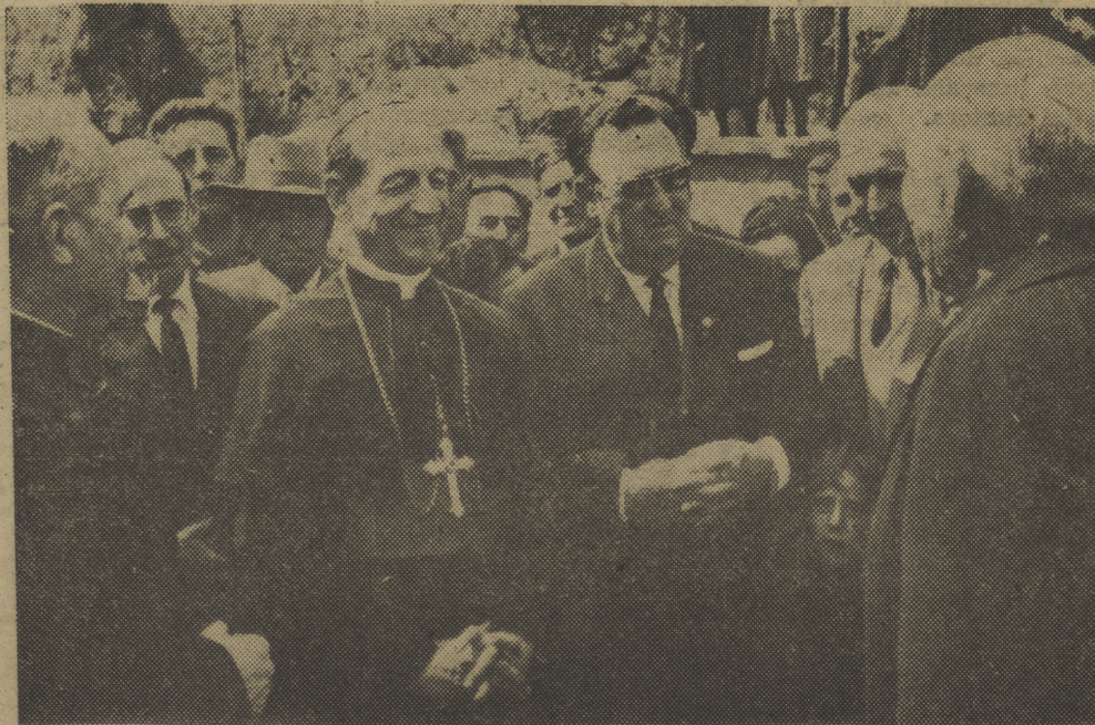
El Nuncio de Su Santidad, monseñor Riberi, acompañado del gobernador civil, señor Izarra, y otras autoridades, conversando con hurdanos, durante su visita a aquella región.