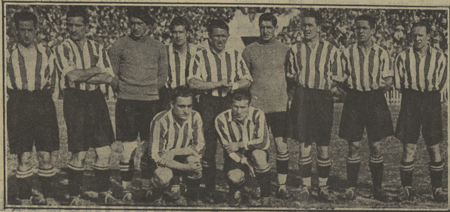
El equipo del Athlétic de Bilbao que infligió el domingo pasado la primera derrota al "Madrid F. C.", leader de la competición de liga.

Esta vez la lucha se ha salido de sus habituales formas de competencia por la potente falta de forma, y, sobre todo, fondo de los castellanos.