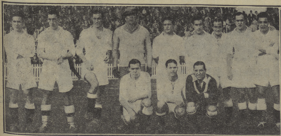
El equip6 del «Madrid F. C.» (campe6n de Liga), que en Montjuich intentará arrebatar el título a los bilbaínos.