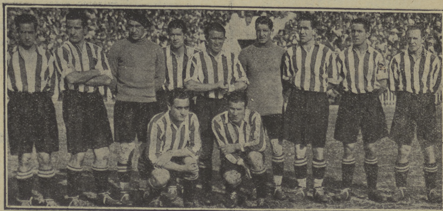
El equipo del Athletic de Bilbao, que el domingo pondrá en juego su título de campe6n de España frente al Madrid F. C.