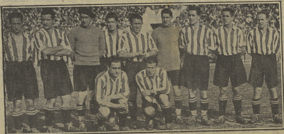
El gran once del Athletic de Bilbao, que el domingo conquistó por decimotercera vez el campeonato de España

Fué una final entre dos técnicas diametralmente opuestas. El Barcelona hizo uno de sus mejores partidos. El Imperio madrileño, campeón "amateur"