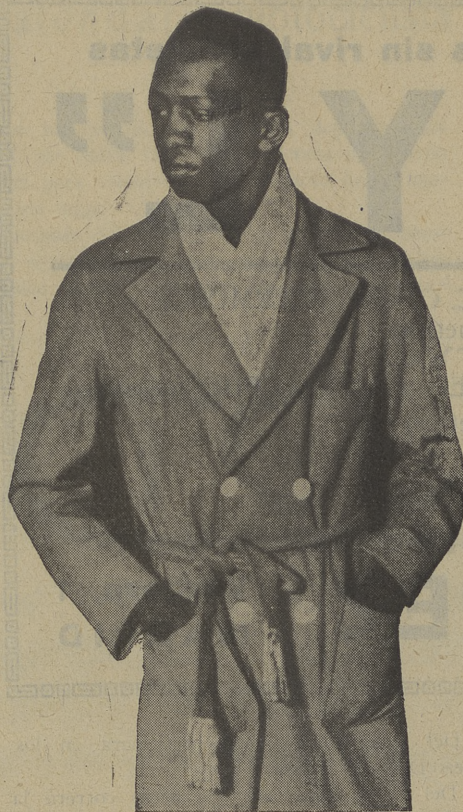
Alf Brown, el campeón mundial del peso gallo que ha sido batido netamente por el filipino "Speedy" Dado

Hasta el momento actual aparecen inscritas para la Copa Davis las dieciséis naciones siguientes: