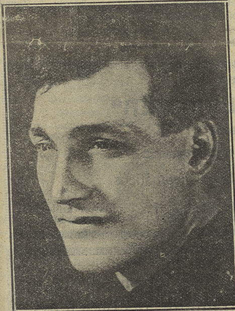
Andrés Leducq, el gran corredor ciclista francés, que ha triunfado en la carrera "Paris-Tours"

El Valencia no supo lograr la victoria sobre los catalanes, victoria que ateniéndose a los últimos resultados obtenidos por ambos equipos, era fácil de conseguir.