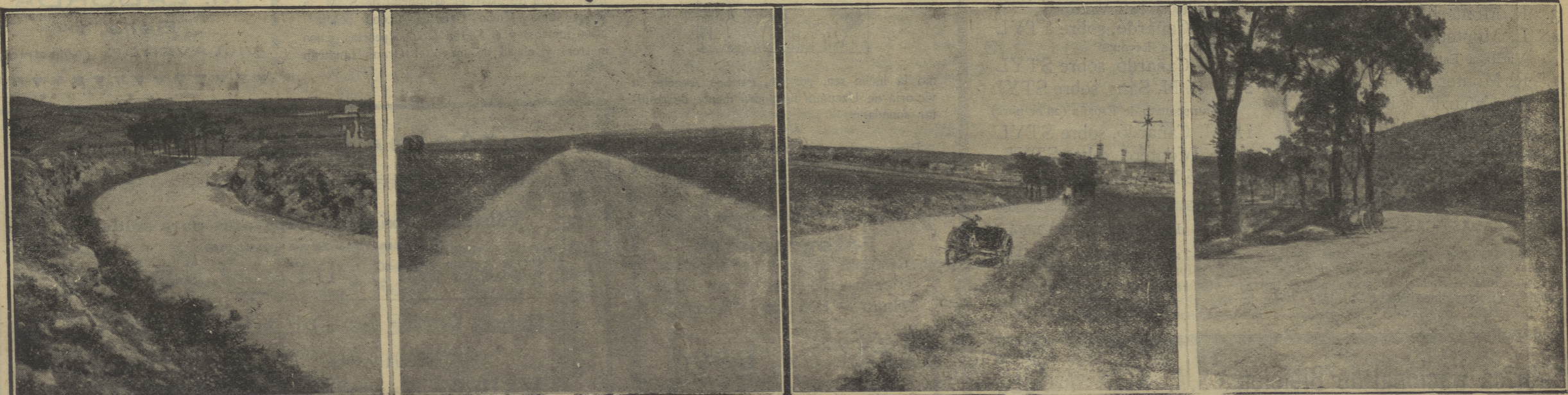
Varios aspectos del pintoresco circuito de Campo Real, en donde la fenecida "Peña Motorista" madrileña verificó hace años una carrera de velocidad de motos y autociclos y en donde el "Real Moto Club de España" celebrará el próximo día 29 de marzo una prueba, también de velocidad, de tres horas, con importantes premios en metálico para motos y coches hasta 1.000 cc.