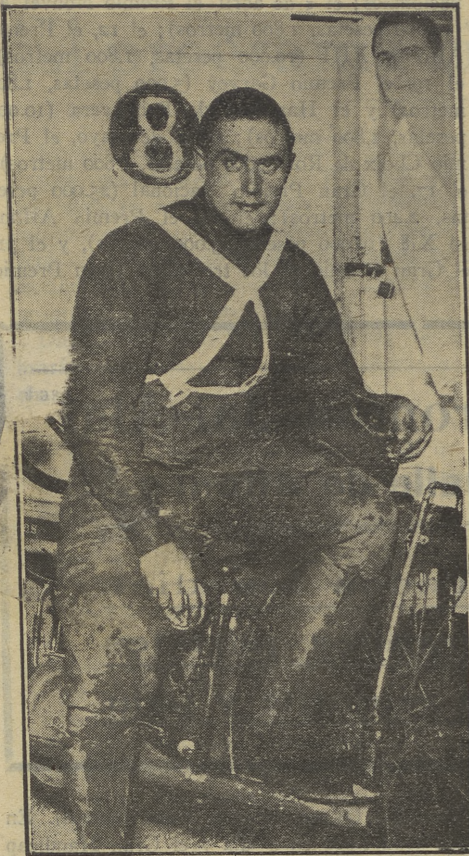
Cliff Parkinsón, el famoso corredor inglés de "Dirt-track" que ha sido contratado para actuar en la pista del "Stadium" en la próxima temporada

peonístico. No hay equipo, en efecto, con mayor mordiente en España, y eso no es debido a un mero azar, como, verbi gracia, el tener a sus jugadores fuertes y en mejor forma que nunca. Esto no basta; se requiere algo mucho más eficaz, y ese algo es la táctica de lucha, es la disciplina y el entrenador Mr. Petland.