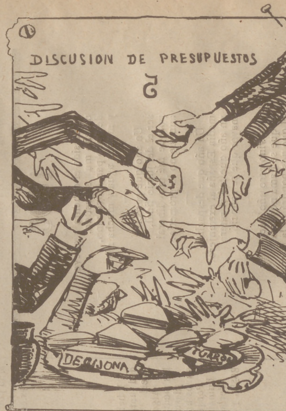
Y al tratar de presupuestos sucedió... lo pue sucede siempre con hombres como estos.