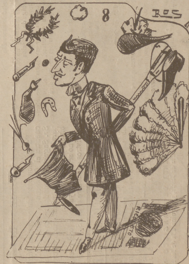
Además, de éxito en pòs debutó en este periódico nuestro dibujante.....