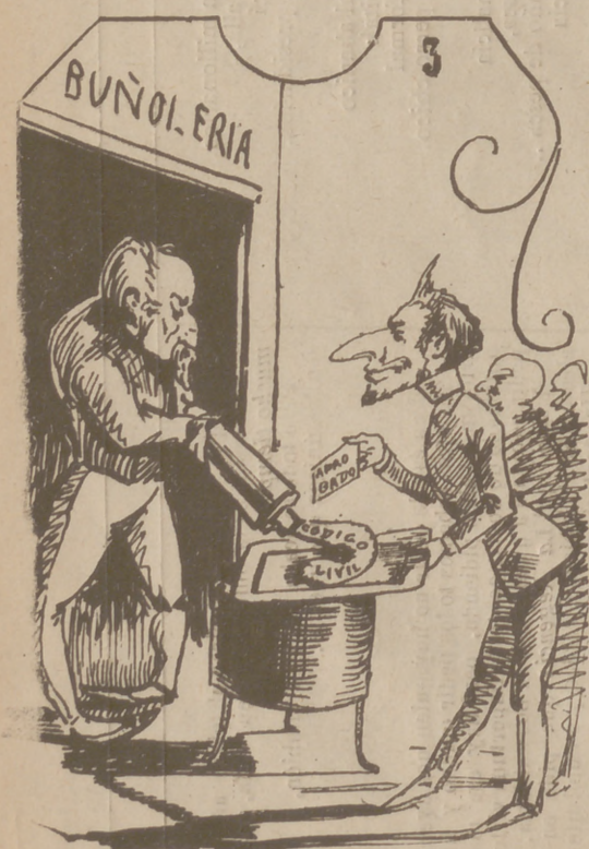
Iste loatus articulus probavit veritas carminis mons parturient mus ridiculus.