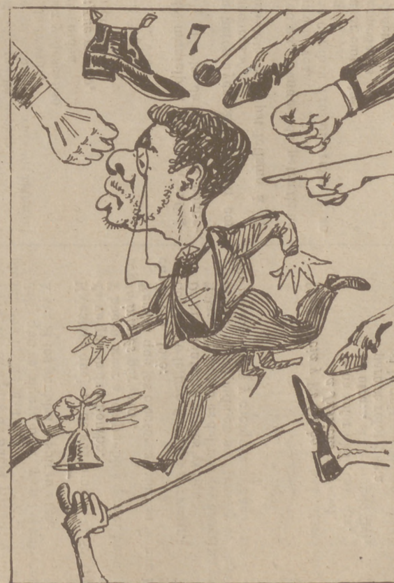
Además de todo eso hubo la primera bronca en el salón del Congreso.