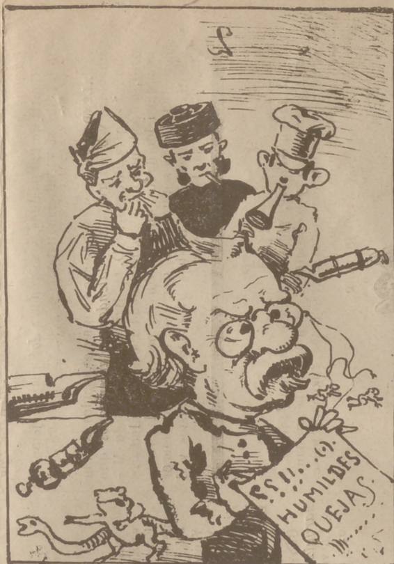
Este señor, de regreso presentó sus justas quejas al Gobierno en el Congreso