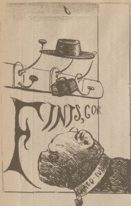
El deseado final del famoso drama de la calle de Fuencarral.