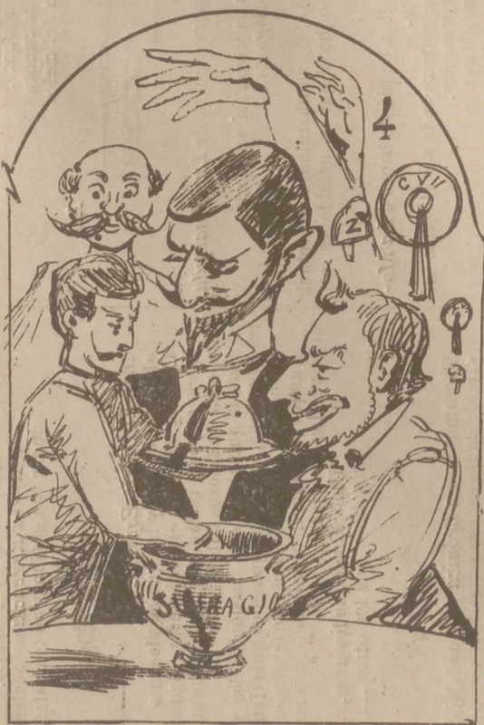
Y se habló con mucha sal destapando la sopera del naufragio universal.