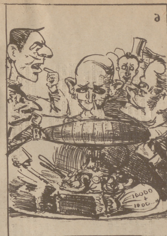
Y en alegre festival se hicieron algunas pruebas del submarino Peral.