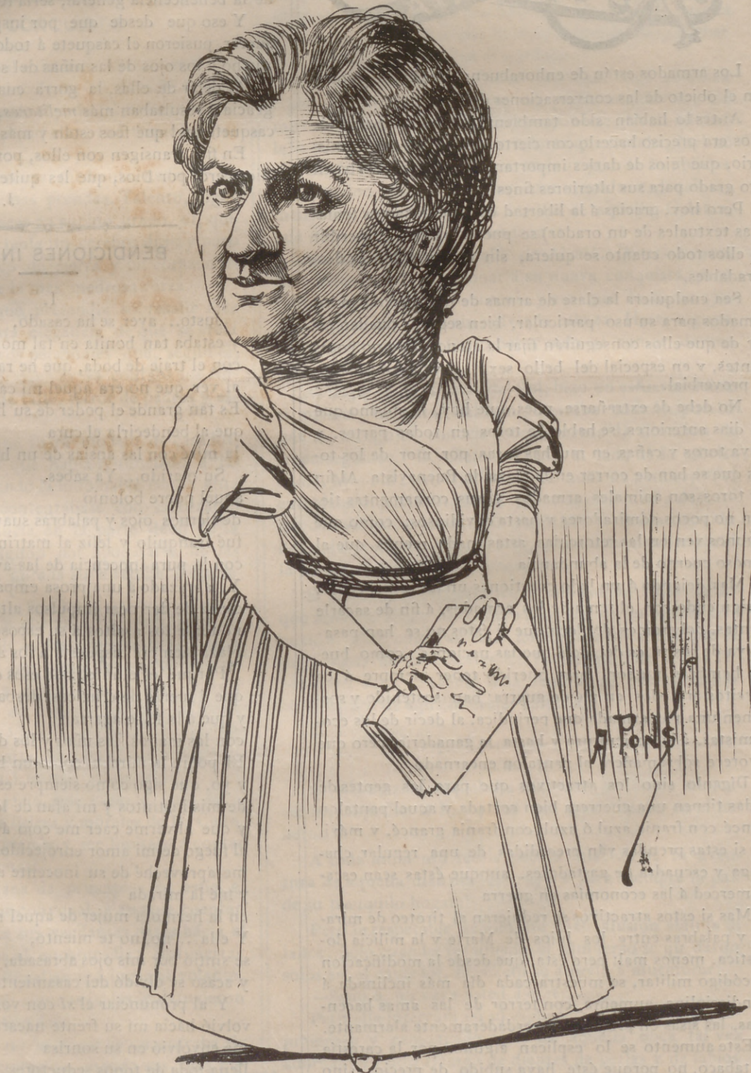
Noveladora eminente y autora muy elegante, que sin gran inconveniente ha resuelto el expediente