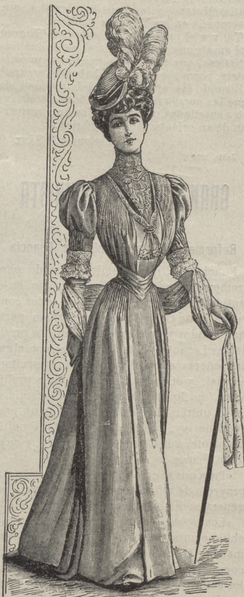
Traje de tarde. —La falda se monta por pequeños pliegues, solapas de terciopelo verde con corbata, chaleco de encaje, mangas farol puño al codo y volantes de encaje, sombrero de crin verde, con plumas verdes y rosas blancas.