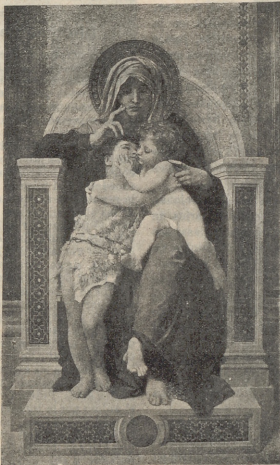
LA VIRGEN MARÍA, EL NIÑO JESUS Y SAN JUAN BAUTISTA Grupo de gran arte y poesía religiosa.