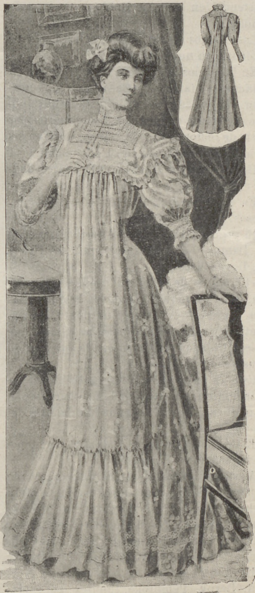
Peinador elegante á pequeños pliegues, mangas bufantes semi cortas, cuello grande adornado de bordados y encajes de Buelillos madrileño,

Este es el mejor remedio para no padecer enfermedades.