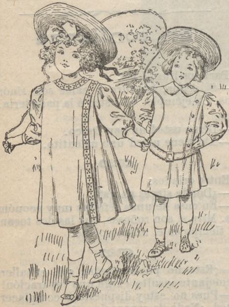
Trajes abrigos para niños, el primero es imperio y de una sencillez encantadora, y el segundo puede servir el mismo, pero añadiéndole cinturón.

—Ya sabe usted que algunas obras que estoy haciendo en mi hotel me han retenido en Madrid más de lo que hubiera deseado. Mi afición por los encajes me hacía considerar como un espectáculo sin igual para mí la Exposición que se estaba celebrando en París, y que, desgraciadamente, se ha cerrado sin que yo la vea. Una amiga, más afortunada que yo, me escribe desde París, maravillada de cuanto ha podido admirar en dicha Exposición. Parece que el traje de boda que lució la Emperatriz María Luisa y