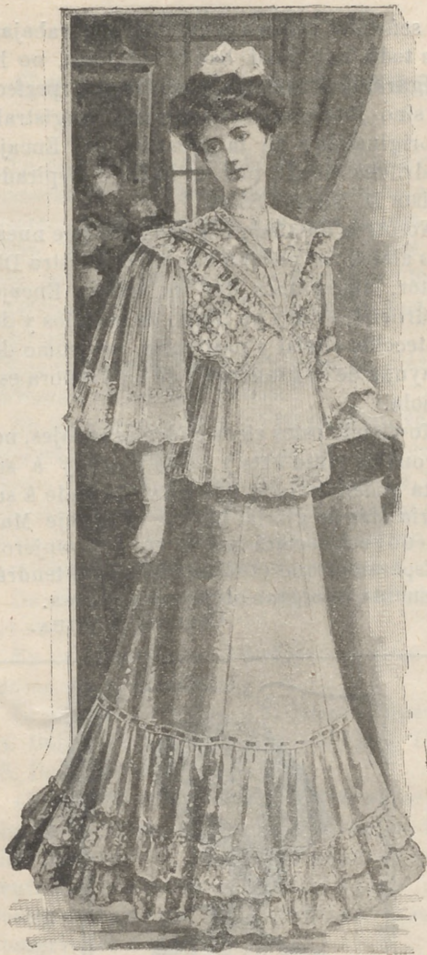
Matinée elegante, plegado acordeón, mangas bufantes largas de velo bordado, cuello grande bordado, adornado de finos encajes madrileños.