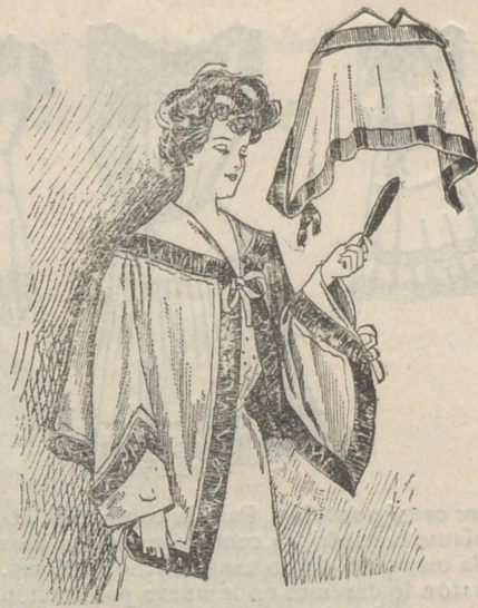
Salida de noche, sin costura, se hace en lana blanca, adornada de bias de terciopelo azul pálido; este precioso abrigo, de casa, es para jóvenes y señoras jóvenes y es complemento de un equipo.

el de encaje de Alençon fabricado en dicha ciudad en 1855 para la Emperatriz Eugenia, son de lo más hermoso y rico que pueda idearse. Quizá más bello aún el de la segunda esposa de Napoleón I.