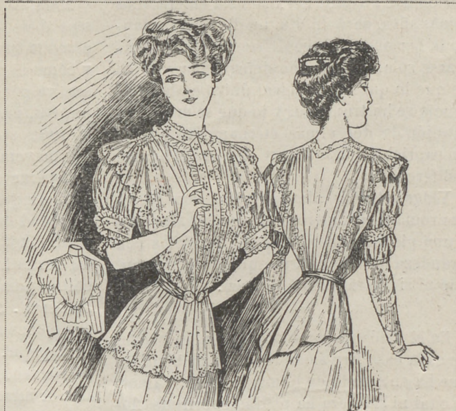
Cuerpo blusa larga, para casa, para señora joven, en batista de seda bordada, formando atrás y delante gran solapa fruncida en el hombro, mangas medio cortas, con adorno y cinturón de seda con broche, adornos de entre-doses de Valenciennes.

Pienso muchas veces en las andanzas de los amores y amoríos de tristes destinos,