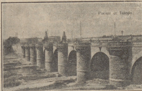
Puente de Toledo