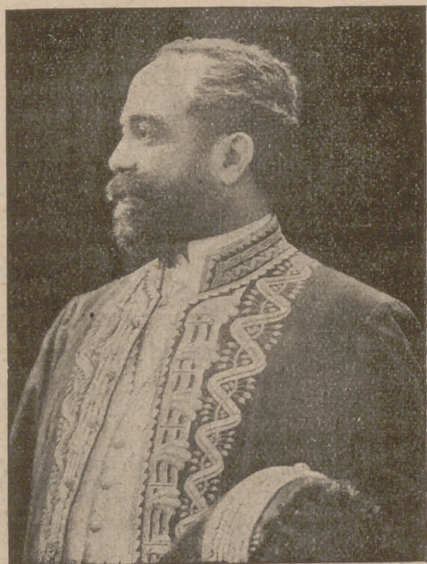
Director de La Ilustración Postal .