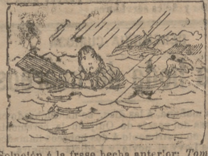
Solución a la frase hecha anterior: Tomar el rabano por las hojas.