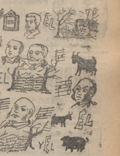
Solución al jeroglífico anterior: La caída de la tarde es cuando el sol se va.