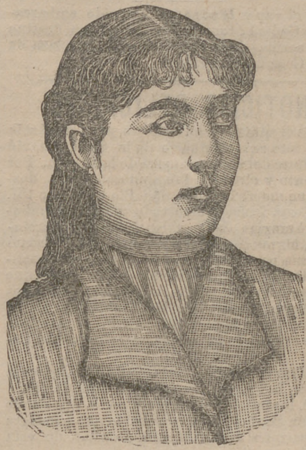
LA REINA NATALIA

Nombróse una regencia durante la minoridad del rey, de la que fué principal elemento Juan Ristitch, afecto al rey Milano.