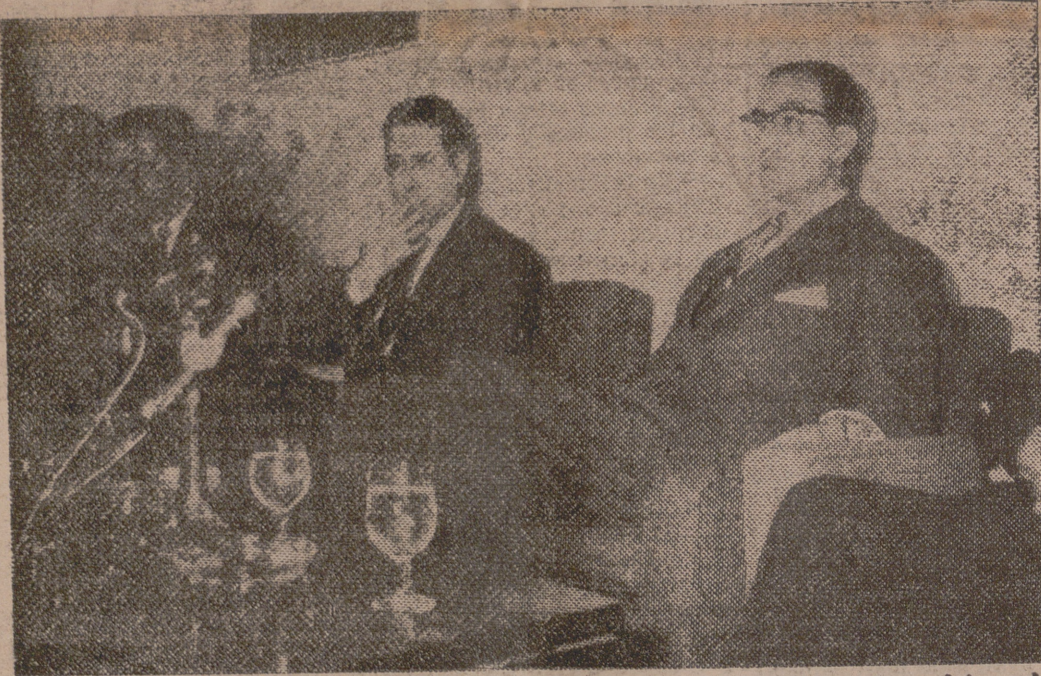
El ministro de Comercio, don Alberto Ullastres, durante la entrevista celebrada con los periodistas en el Club Internacional de Prensa de Madrid. Habló de su reciente viaje por varios Estados del Oeste de Africa, como del interés que en los mismos se siente por España.—(Foto Fiel).