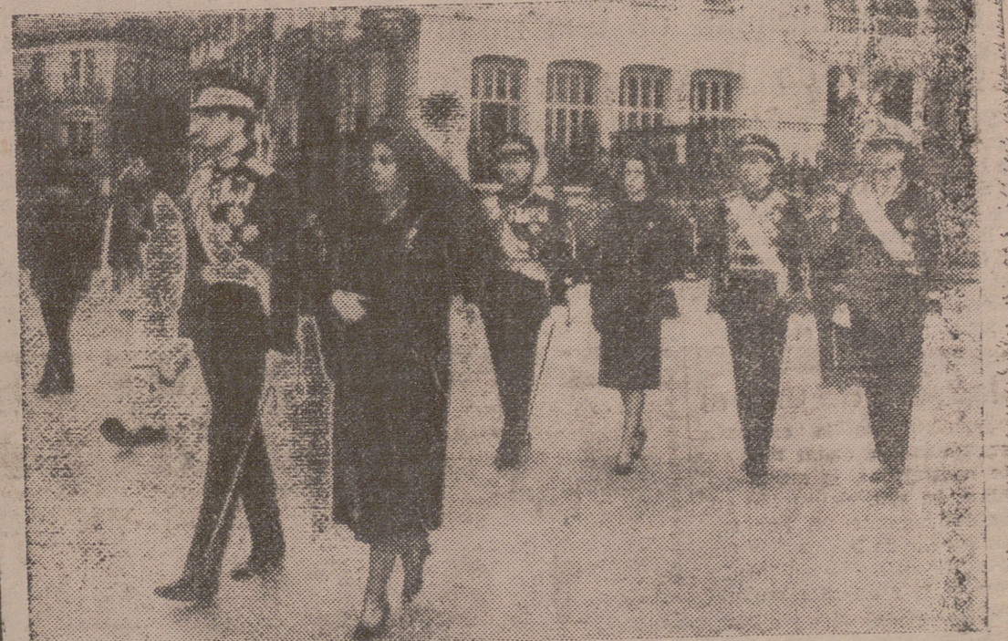
Constantino II de Grecia, acompañado de su madre, la reina Federica, fue el acto de sepelio del fallecido monarca. En segundo plano aparecen el príncipe Juan Carlos de Borbón y la princesa Sofía, su esposa.

COPENHAGUE, 13.—La boda del rey Constantino de Grecia y la princesa Ana de Dinamarca se celebrará este año y la fecha será anunciada antes de ser acordado, oficialmente, en la Secretaría del Palacio Real.