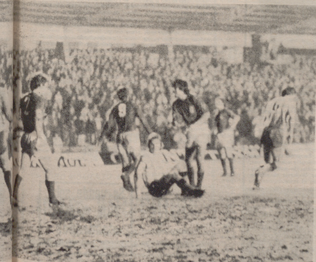
Rusky en el suelo, después de rematar fuera un balón en el último minuto del partido. Moré corre al campo y los jugadores ovetenses respiran tranquilos: había pasado el susto...