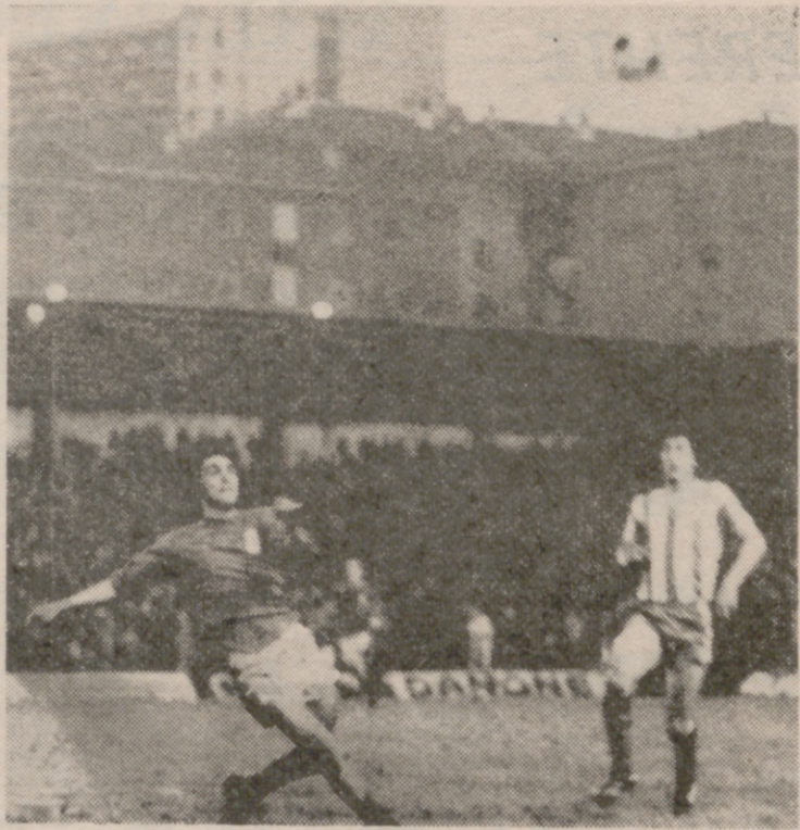
Un zaguero ovetense se cruza ante Palacios, logrando despejar el balón.