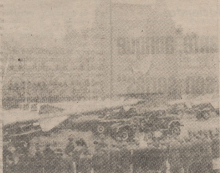
MOSCU.—Un momento de la parada militar celebrada en la Plaza Roja de Moscú en el 59 aniversario de la revolución bolchevique.

MOSCU. (Efe).—La distensión está reforzada por una política militar vigilante y el internacionalismo proletario, ha subrayado ayer el Ministro de Defensa soviético, mariscal Dimitri Ustinov, con ocasión del gran desfile militar y cívico conmemorativo de la revolución de octubre.