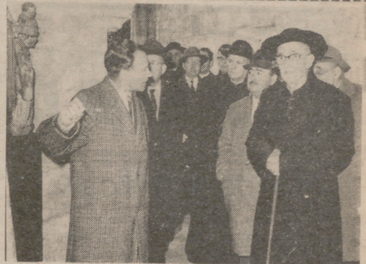
El arzobispo García Goldáraz, con el señor Watterberg en primer término, y acompañado de las primeras autoridades de entonces, en la inauguración del Museo de la Catedral.

Fui gobernador civil de Alicante en tiempos en que García Goldáraz era obispo de Orihuela; fui gobernador civil de Valladolid cuando él ocupaba su sede arzobispal. La doble coincidencia, que dio lugar a un trato muy prolon-