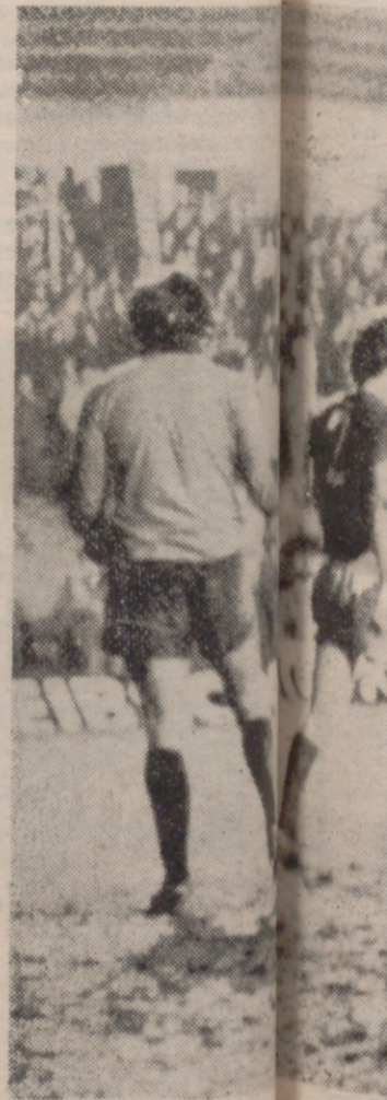
PUDO SER EL EMP... en el s... campo y l...