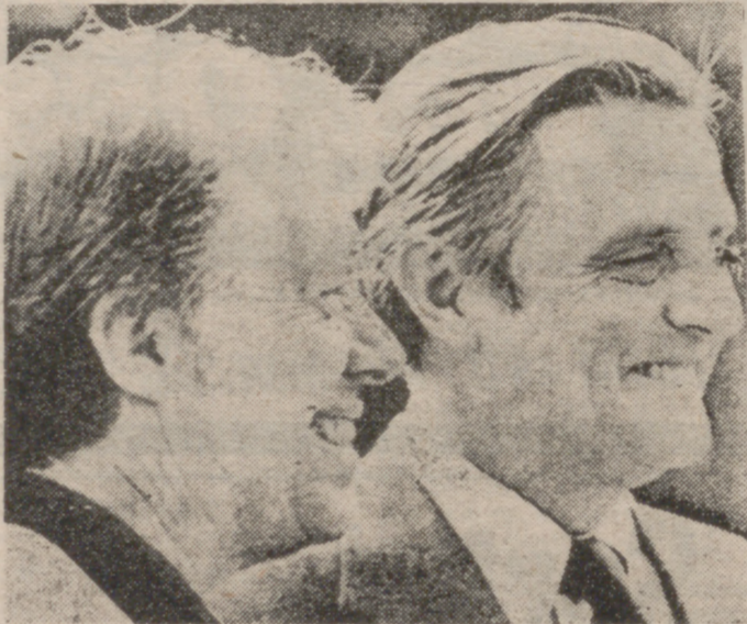
El Presidente electo de los Estados Unidos, Jimmy Carter, posa en Georgia para los fotógrafos, acompañado del Vicepresidente, Mondale.

— En su pueblo fue prohibida la entrada en la iglesia a los negros