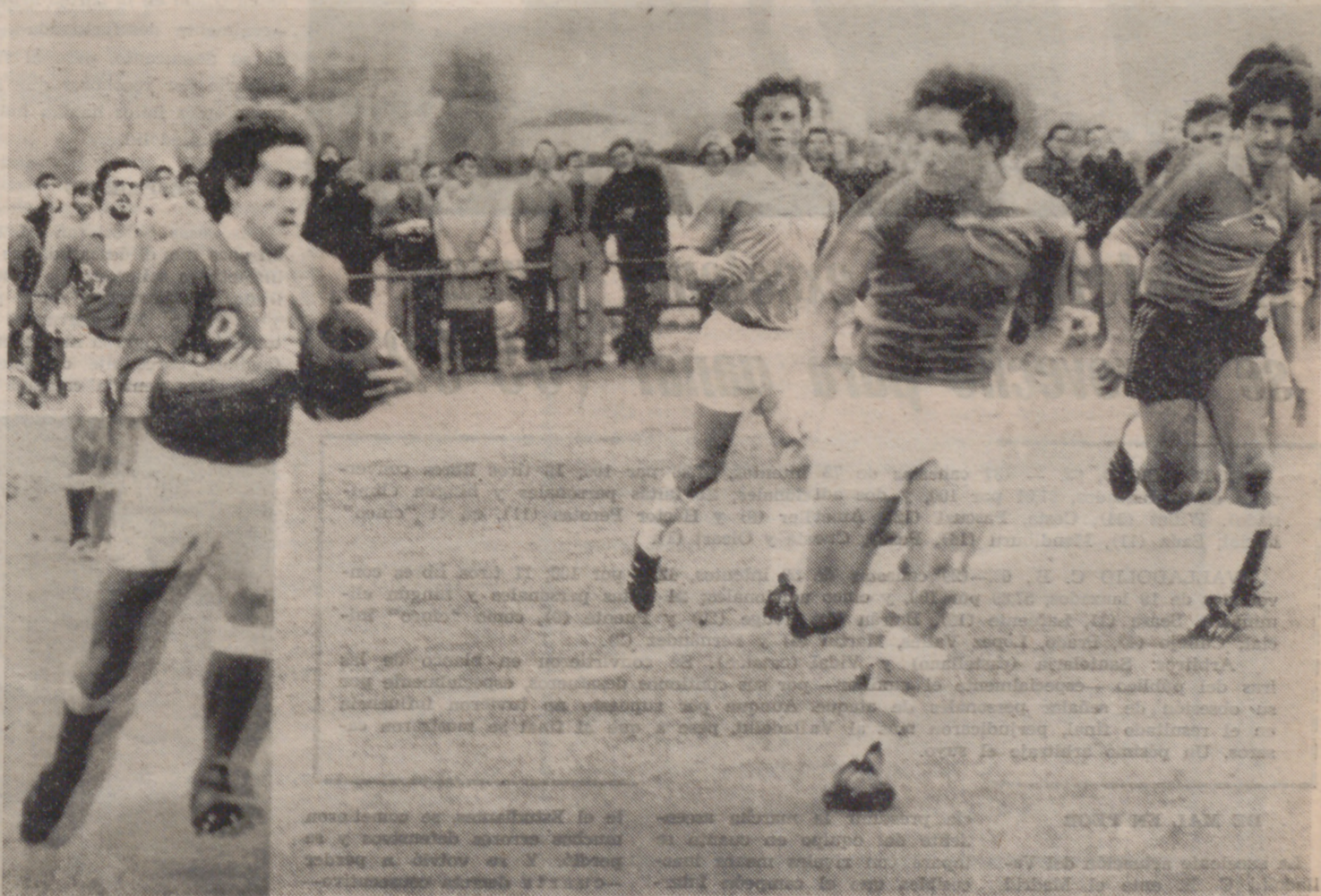
Gijón, el veloz "tres cuartos" internacional, perseguido por varios contrarios.