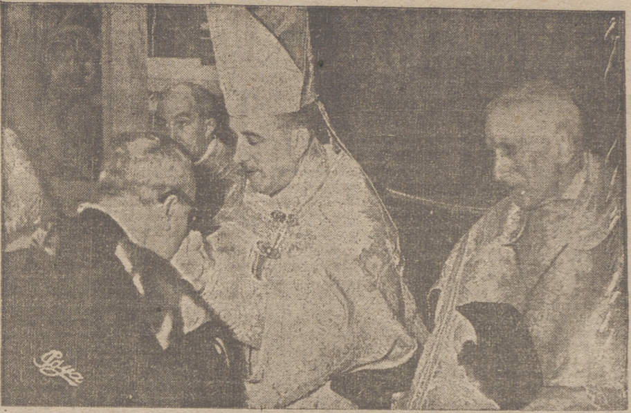
(Viene de primera página)

prestó el tradicional juramento ante el Libro Juratorio, del siglo XV, forrado en terciopelo verde, con manillas de plata, jurando guardar los estatutos y privilegios y loables costumbres de la S. I. Catedral, y después de poner incienso y recibir el asperges, pasó a la capilla de San Pedro, donde oró ante el Santísimo reservado, adorándole durante unos minutos, pasando seguidamente al altar mayor, mientras la capilla de música de la catedral, reforzada con la coral de PP. Agustinos y seminaristas, entonaban el solemne Te Deum, cantándose después el Himno al prelado, del maestro Salner, director de la banda municipal de música de Calahorra, himno majestuoso a gran orquesta y a cuatro voces. Cantada la antífona y oración, el doctor Del Campo ocupó su trono, recibiendo el homenaje de los tres cabildos de su diócesis, de la representación de Burgos y sacerdotes que pudieron ocupar lugar en el presbiterio. En la catedral se habían señalado los puestos para autoridades y fieles. Pero todo resultó insuficiente. La Vía Sacra estaba ocupada plenamente por las autoridades y hasta el último rincón de la más escondida capilla estaba materialmente abarrotado. Gracias al servicio de altavoces, los miliares de personas que