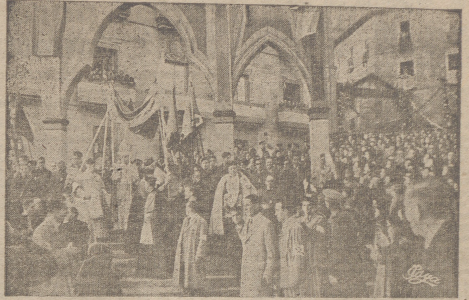
no pudieron entrar en el amplio templo catedralicio pudieron seguir los actos que allí se celebraban. El señor obispo pronunció desde el púlpito la emotiva y elocuente