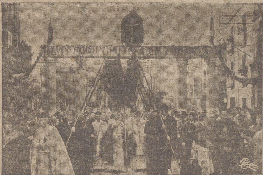
(De nuestro corresponsal)