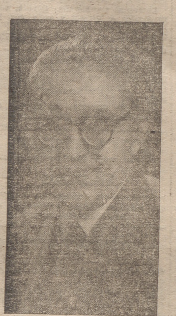
El hombre del cual se sirvió la Providencia en 1936 para auxiliar a España se llama Francisco Franco. A Dios gracias, sigue siendo hoy, en 1953, nuestro Caudillo. Los principios de su Gobierno son sencillos, tan sencillos como éstos:

Esto, y sólo esto, españoles de menos de treinta años, fué el