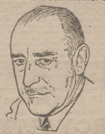
Trabajos de la Conferencia Agrícola Europea "Pool-Verde" a la que se ha incorporado España...