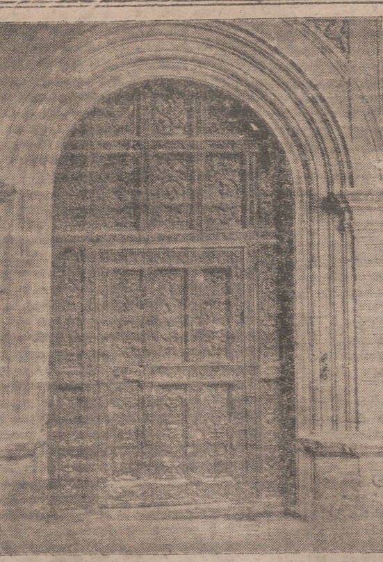
«Puerta plateresca del Claustro de los Caballeros, de Santa María la Real, cuya filigrana y perfección en la talla causa admiración y justos elogios de los más competentes arqueólogos y artistas».