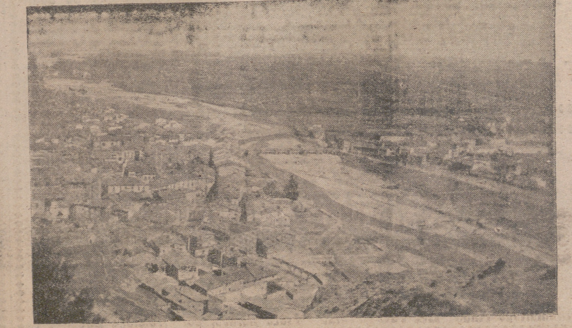
NAJERA. VISTA DESDE EL CASTILLO.