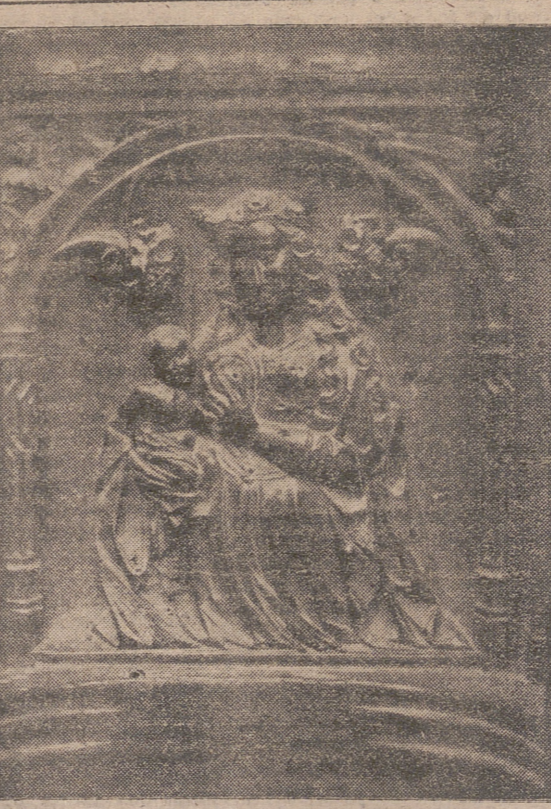
«Detalle del magnífico coro ojival de Santa María la Real, obra de la época de los Reyes Católicos, que se atribuye a los escultores Andrés y Nicolás Amutio, vecinos de Cárdenas».