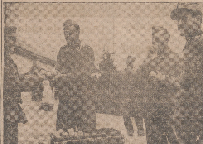
Este grupo de cazadores alemanes muestra su contenido ante un inesperado reparto de fruta.