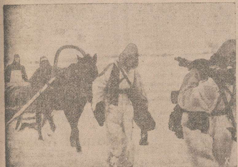
ARMAS Y ABASTECIMIENTOS SON TRANSPORTADOS POR LOS ALEMANES EN EL TRINEO RUSO A LA LINEA PRINCIPAL DE LA LUCHA.

Una numerosa formación soviética quedó cercada y, mas tarde, aniquilada totalmente