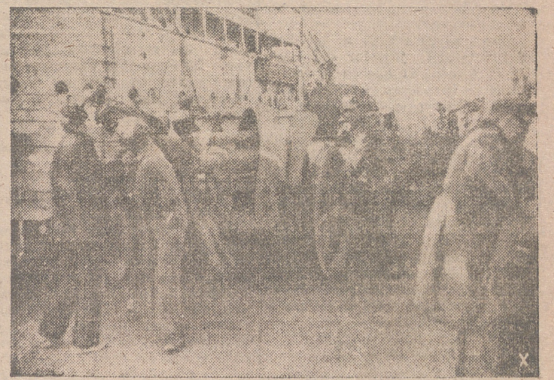
Frecuentemente llegan a Creta convoyes transportando cañones y diverso material bélico para aumentar las fortificaciones de la isla.