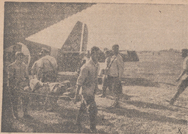
Individuos del Servicio de Trabajo además trasladan los soldados heridos, llegados en avión, hasta una ambulancia, en el sector Sur del frente.