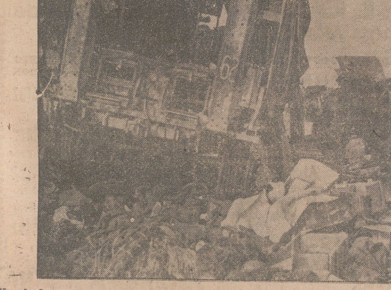
Los ingleses en su huida dejaron abandonados camiones y otro material que ha caído en poder de los soldados alemanes.