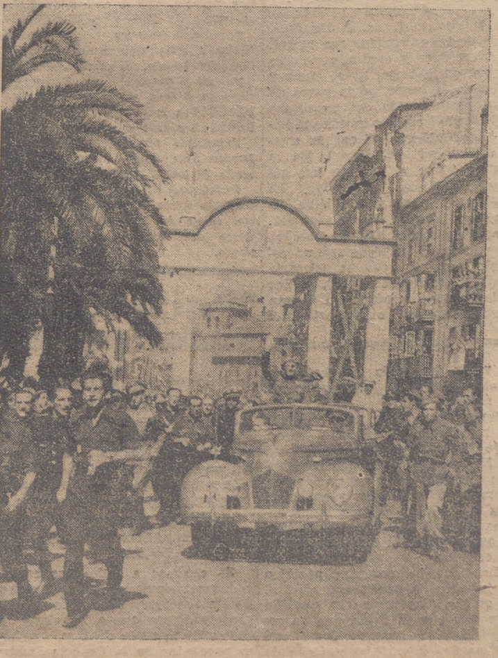
EL CAUDILLO ES ACLAMADO Y SALUDA BRAZO EN ALTO