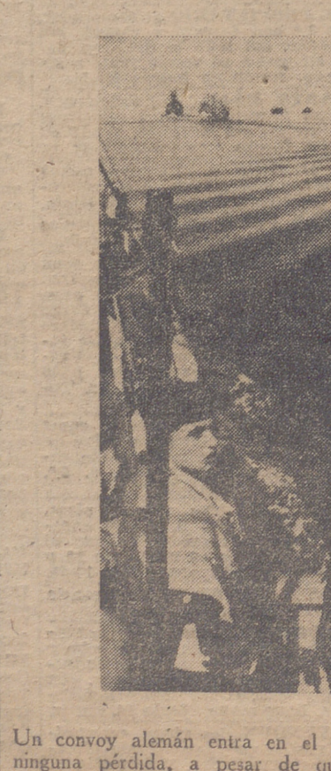
Un convoy alemán entra en el puerto de destino sin haber tenido ninguna pérdida, a pesar de que sufrió el ataque del enemigo