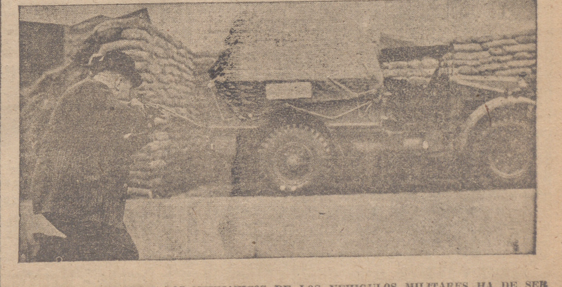
EL CAUCHO DESTINADO A LOS NEUMATICOS DE LOS VEHICULOS MILITARES HA DE SER DE GRAN RESISTENCIA, Y ES SOMETIDO A LA PRUEBA DE SER TIROTEADOS A TAN CORTA DISTANCIA.