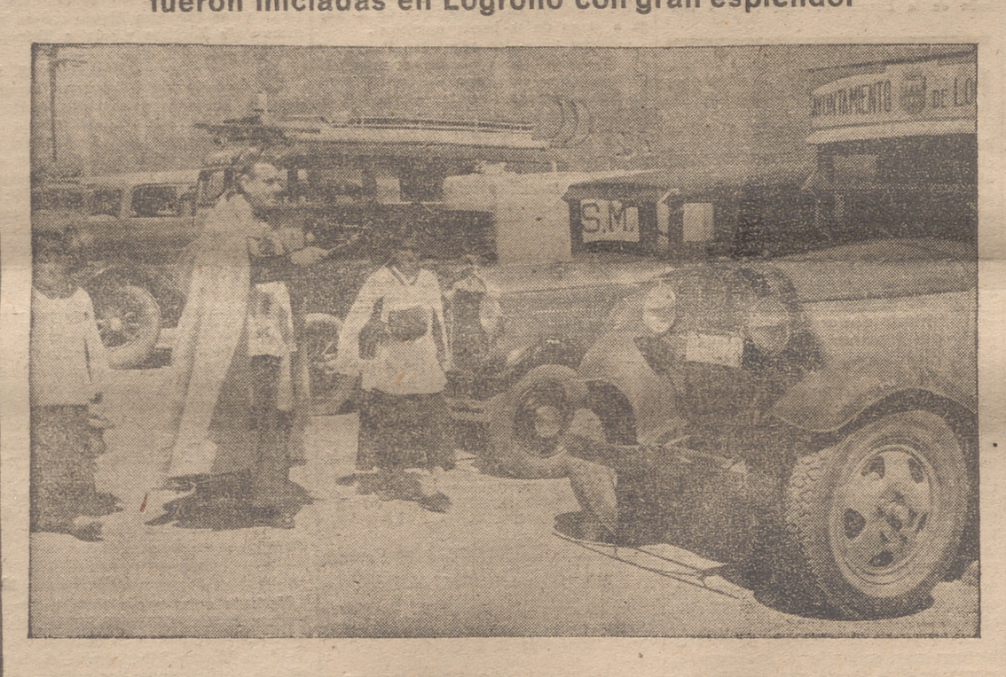
UN MOMENTO DE LA BENDICION DE COCHES FRENTE A LA RED ONDA.