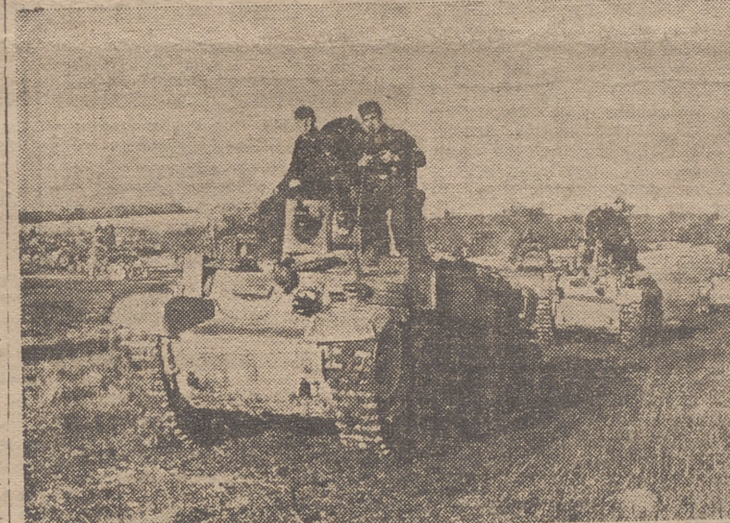
SECCION DE TANQUES ALEMANES DE VANGUARDIA ESPERANDO LA ORDEN DE AVANZAR SOBRE LAS POSICIONES ROJAS