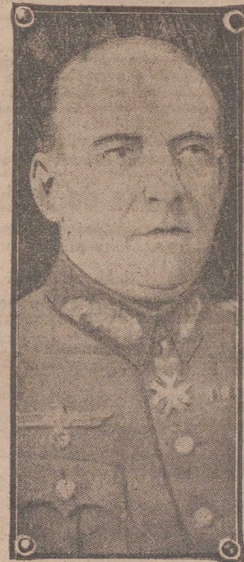
M. WISTON CHURCHIL, QUE DIRIGE LA POLITICA DE GUERRA INGLESA Y QUE CERRO CON UNA DECLARACION, EN NOMBRE DEL GOBIERNO, EL AGITADO DEBATE EN LOS COMUNES SOBRE LA CAMPAÑA DEL NORTE. — EL EXMINISTRO DE LA GUERRA, HOARE BELISHA, QUE VOTO EN CONTRA DEL GOBIERNO AL QUE HASTA HACE POCO PERTENECIO. — EL GENERAL FALKENHOAST, COMANDANTE EN JEFE DE LAS TROPAS ALEMANAS QUE OPERAN VICTORIOSAMENTE EN NORUEGA.