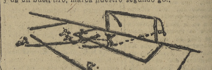
SEXTO GOL. — U. D. Salamanca. A los 42 minutos de la segunda mitad. — Un avance rápido del interior izquierda con la pelota intenta interceptario Mezo, que valientemente se arroja a sus pies. No logra hacerse con la pelota y el Salamanca marca su cuarto gol.