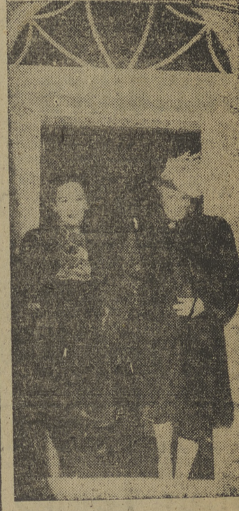
La esposa del generalísimo Chang-Kai-Chek (izquierda), acompañada de la esposa del secretario de Estado, Marshall, sale de Blair House—residencia provisional del presidente Truman—después de discutir con éste los problemas chinos y sin haber conseguido, al parecer, la ayuda masiva que necesita su marido para salir del atolladero en que se encuentra.

En los círculos oficiales de Washington se rumorea que acaso no sea un accidente, como se pretendía basándose en que ya es un poco raro la serie seguida de "accidentes" que vienen sucediendo a cuantos han intervenido en el Tribunal de Actividades Antinorteamericanas.