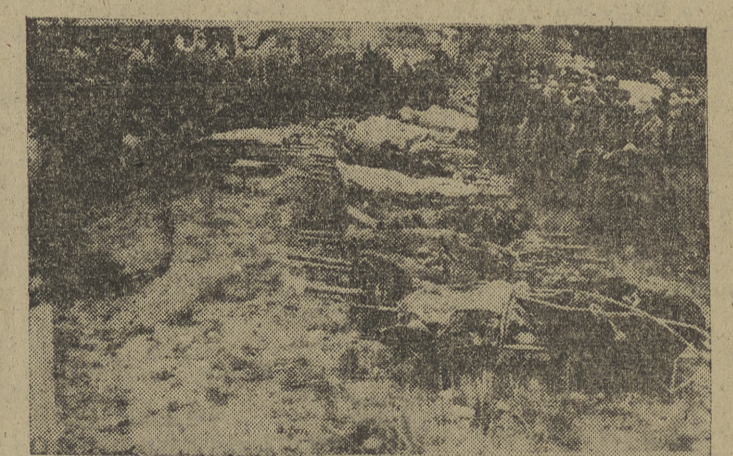
En la fotografía, alineados en camillas, se ven los cuerpos de las veintinueve víctimas—veintiséis pasajeros y tres tripulantes—que perecieron al estrellarse el avión "Dakota", de la Iberia, de la línea Madrid-Barcelona, en la sierra de Pandols. Los cadáveres de las víctimas esperan, en el momento de tirarse la "foto", su traslado a Gandesa.