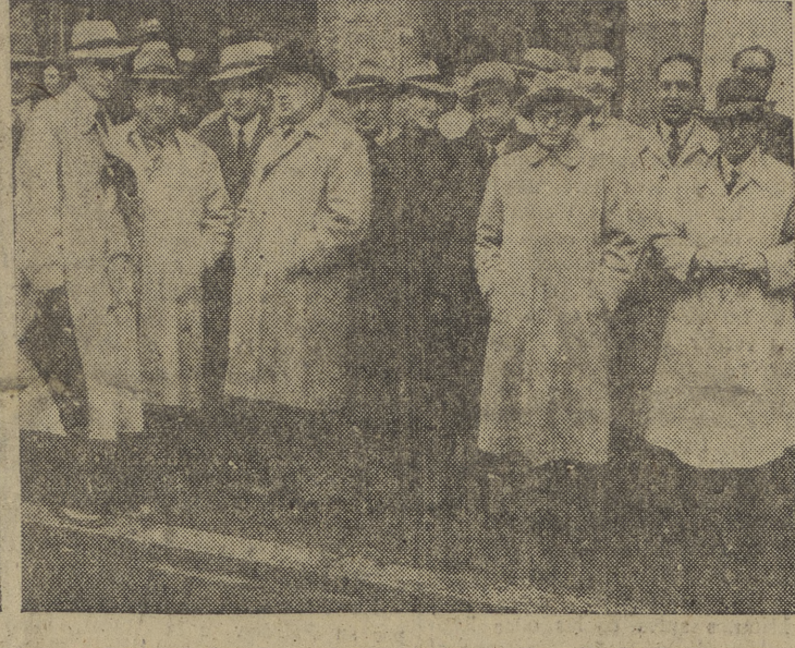
Notas gráficas del día de la Inmaculada en Burgos. — El gobernador civil durante su discurso a los miembros de la Cruz Roja. — El capitán general pasa revista a las fuerzas de Infantería. — Grupo de abogados del ilustre Colegio burgalés des pués de la misa celebrada en el Carmen.