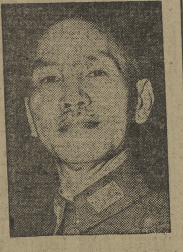
Medio mundo estará bajo control comunista

WASHINGTON, 26. — De nuestro corresponsal, LORENZO GARZA. El colapso total de China bajo el ataque triunfal de los rojos, según los especialistas militares de aquí, puede producirse en un plazo de tres a seis meses. Al ocurrir esto, medio mundo pasa a caer bajo el control comunista, quedando sólo la esperanza, un poco floja, de que la futura administración presidida por Dewey llegue a tiempo de hacer algo para salvar a Chang-Kai-shek. (Efe.)