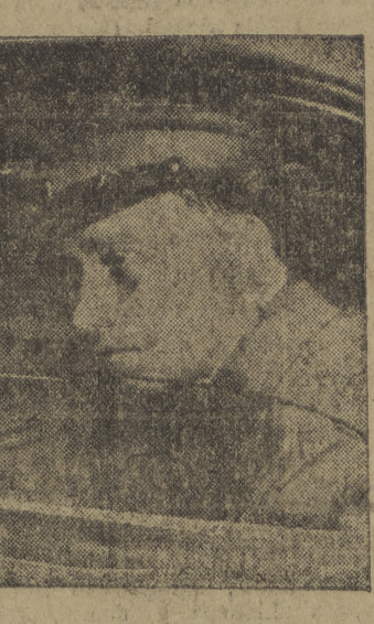
En el curso de unas operaciones secretas realizadas en Oceanide, California, se observó entre los observadores asistentes la presencia de un coronel ruso con su correspondiente uniforme. Fue detenido y expulsado del lugar de las maniobras...