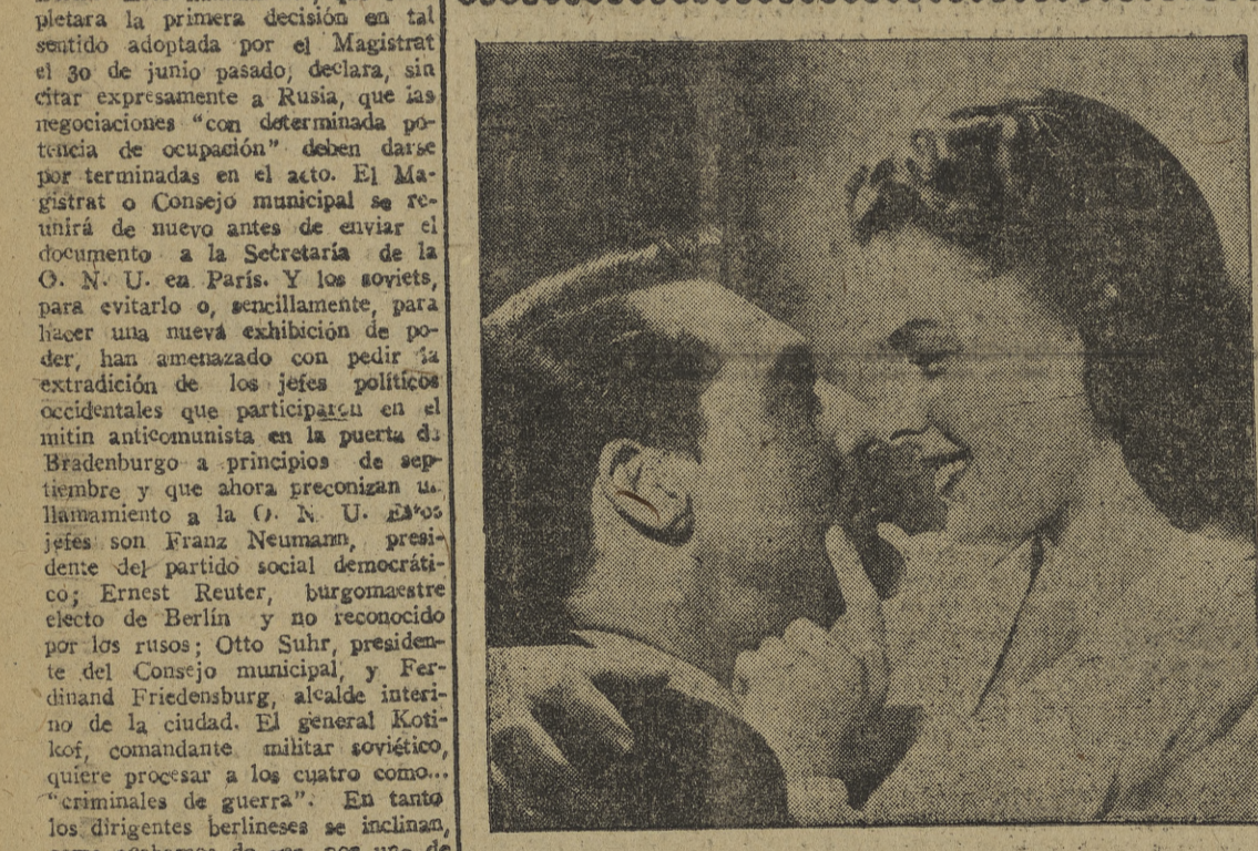
Cary Grant e Ingrid Bergman en "Enocadenados" (Notorius), la gran realización de Hitchcock, maestro de la emoción, como nos demostró en "Rebeca", "Sospecha", "La sombra de una duda" y otras magníficas creaciones sobre los más excepcionales dramas psicológicos que se ven ensombrecidos por la maravilla de esta producción genial que es "Enocadenados", cuyo estreno, con caracteres de acontecimiento sensacional, nos ofrece hoy en su II Jueves de Gala el Gran Teatro

Es de esperar. Estados Unidos no preocupa nada, sea cual sea el resultado de las elecciones del mes próximo, ya que nadie espera el sorprendente triunfo de Wallace. Por está la unión europea, donde la catastrófica situación de Francia ocupa las primeras planas, mientras que el diagnóstico popular da por percibido el régimen, aunque contando optimistamente con el apoyo de la política occidental.