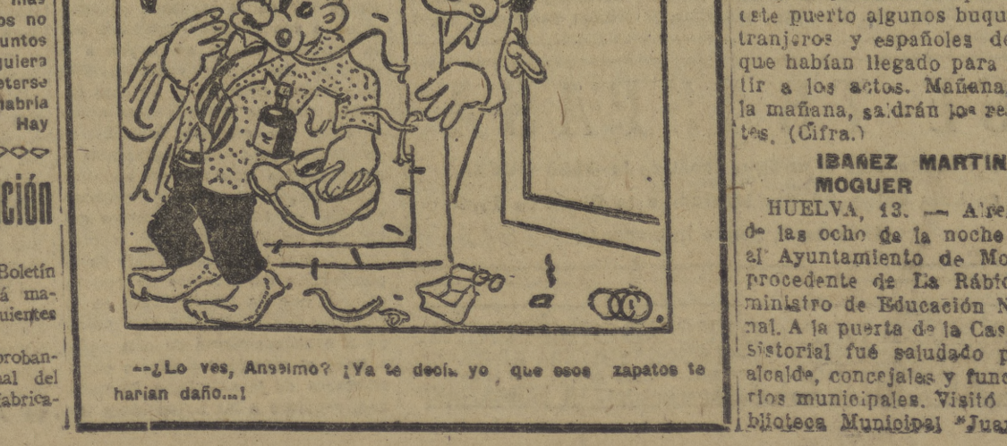
¿Lo ves, Anselmo? ¡Ya te decía yo que esos zapatos te harían daño!