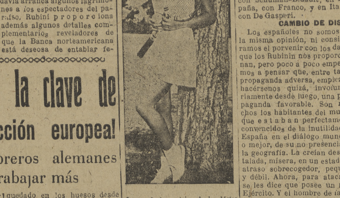
La excelente actriz de la Metro Janet Leigh, que se encuentra en Londres, ha hecho una exhibición de tenis, jugando contra la campeona británica, en un partido celebrado en honor de los participantes femeninas en la Olimpiada. Naturalmente, Janet perdió, pero estamos seguros de que sólo con su presencia aumentaría el número de sus admiradores.