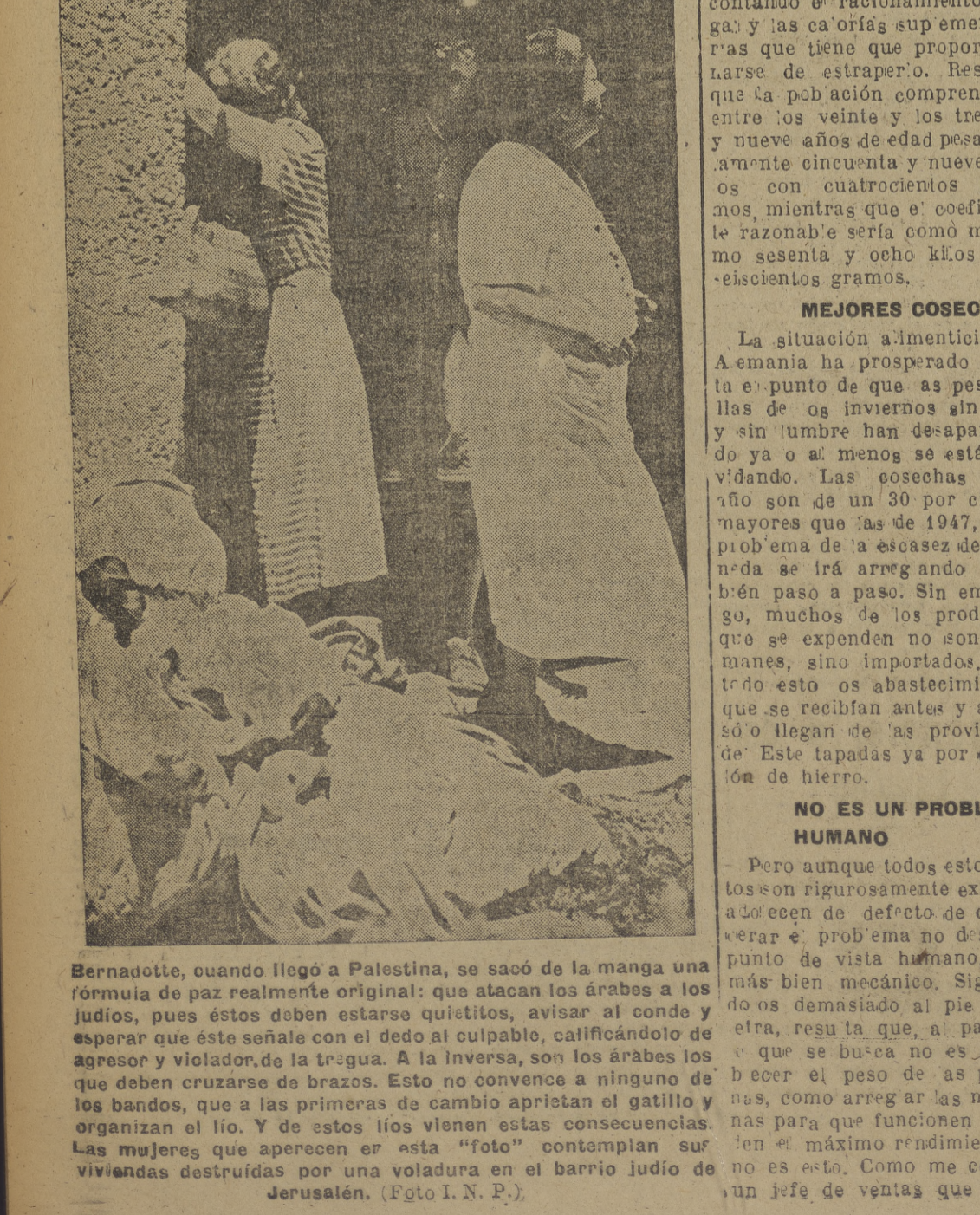
Bernadotte, cuando llegó a Palestina, se sacó de la manga una fórmula de paz realmente original: que atacan los árabes a los judíos, pues éstos deben estar quietos, avisar al conde y esperar que éste señale con el dedo al culpable, calificándolo de agresor y violador de la tregua. A la inversa, son los árabes los que deben cruzarse de brazos. Esto no convence a ninguno de los bandos, que ya de primeras de cambio aprietan el gatillo y organizan el lío. Y de estos líos vienen estas consecuencias. Las mujeres que aparecen en esta "foto" contemplan sus viviendas destruidas por una voladura en el barrio judío de Jerusalén.

Estos es, precisamente, de lo que se trata. Mister Tracy "La Voz de Castilla" Teléfono 2158