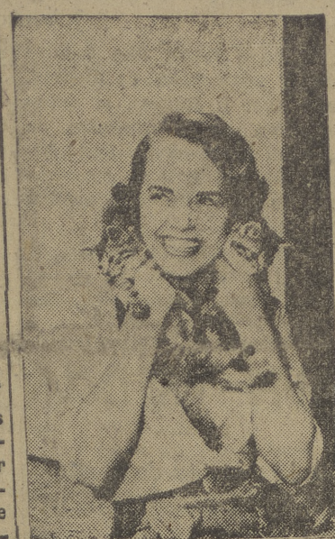
Señala sobre una brazada de heno seco, con dos patitos empujando su prodigiosa barbilla, abierta la sonrisa y en el atestado un aire campesino y despreocupado, presentamos a ustedes —por si no la conocían— a miss Terry Moore, preciosísima estrella de Hollywood. A nosotros, Terry —nombre de coñac de fiestas— nos parece una chica simpática y bastante guapa. ¿Opinarán así los gatos?