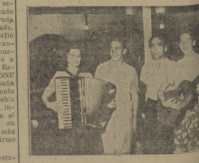
El cuarteto "Los Trotamundos", que en viaje por toda Europa, el lunes a nuestra ciudad, y ayer tarde, en la Residencia de Mayo, dieron un concierto musical, y hoy actuarán en el teatro de la Unión y en el cine Cordón.

(Viene de primera página.) cuales no se habían preocupado todavía en romper la manibrotta fijada por el Kremlin ni el restablecer las relaciones diplomáticas normales con España. Myron Taylor fué el primer representante de presidente Truman, que tuvo una larga y secreta conversación con Franco; descubrió que el fuerte hombre español está guiado por las máximas consideraciones prácticas en relación con los actuales problemas mundiales y que está dispuesto a ponerse a lado de quienes pueden ser víctimas de la agresión soviética. (Efe.)