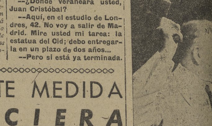
Este señor en actitud un poco extraña, con un mazo en la diestra y mirando al frente, no hace nada más que trabajar. Se trata, simplemente, de una "pose" fotográfica, dura a la que deben someterse todos los hombres públicos que desean ser conocidos por la prensa popular. Mr. Barkley es un estimado conveciente saltara la tumba y aquí le tenemos aquí serio --mientras las cámaras captan su imagen. Y todo por una Comisión demócrata le eligió candidato a la Vicepresidencia.

De ninguna manera. Totalmente me queda, de modelar, por lo menos el mes de agosto. --Pero aquí se va, usted, a pasar de calor? No ha estudiado un medio de refrigeración? --No me hace falta. Esta estatua tiene siete toneladas de barro, el cual, para trabajar, debe estar continuamente fresco. Todo ese barro húmedo produce un clima de refrigeración que hará bastante agradable el ambiente del estudio. Nuestro querido colega "Informaciones", de Madrid, en su sección "Veraneo de los ilustres personajes", publica una entrevista con Juan Cristóbal, que reproducimos a continuación: "En su estudio de la calle de Londres, menudo, ágil, empujando los largos pañillos de alambre, el escultor Juan Cristóbal se mueve en torno a una estatua del Cid Campeador, destinada a decorar una plaza burgalesa. Más de cuatro metros mide la colosal figura. A su alrededor, el artista agudiza los zarpazos justos, oportunos, que van perfeccionando el barro coqueste. --¿Dónde veraneará usted, Juan Cristóbal? --Aquí, en el estudio de Londres, 42. No voy a salir de Madrid. Mire usted mi tarea: la estatua del Cid; debo entregarla en un plazo de dos años... --Pero si está ya terminada.