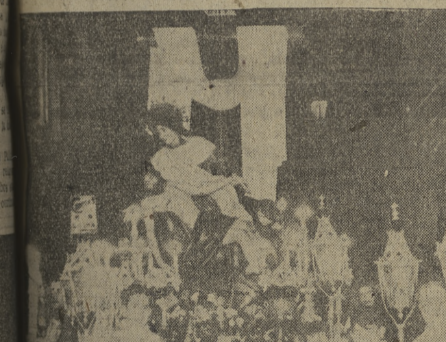
Exaltación maravillosa de un pueblo que conmemora con un singularísimo sentido la tragedia del Gólgota... Por las calles principales, entre el silencio y la oración unánime de los fieles, desfilaron los "pasos", redoblán, destemplados, los tambores, multitud se inclina de rodillas. Obras sobrias, muy a tono con el espíritu de nuestro pueblo, que nos recuerdan las escenas de la Biblia, como éstas de "El Beso de Judas" (arriba), "La Coronación de Espinas" (centro) y "El Despedimiento", figuran en este cortejo de piedad y de fe.