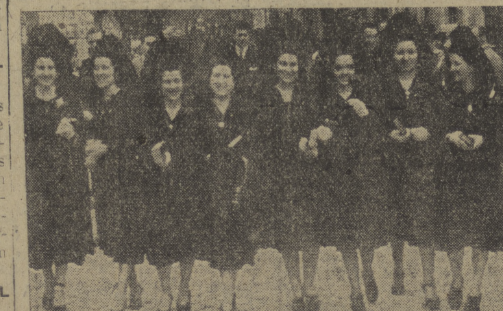
Las mantillas de Semana Santa — recogimiento en el templo y alegría en la calle — han realizado, en estos días, la belleza de las burguesas, que han puesto en el ambiente de la ciudad la nota señera de la clásica prenda española.