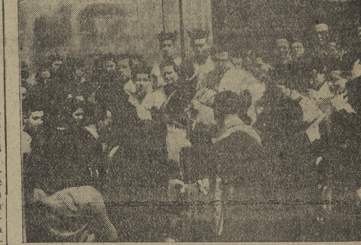
Fuente al lujo deslumbrante, característica de otros lugares, subraya la significación de las conmemoraciones de Semana Santa en la Cabeza de Castilla, la piedad del pueblo manifestada en conmovedoras escenas que, como estas, reproducen el "Encuentro", en la procesión del Jueves (arriba); la imagen de Jesús con la Cruz a cuestas cruzando las calles entre el fervor de los fieles (centro) y nuestro reverendísimo prelado, recibiendo una muestra fiel de la fervorosa adhesión y cariño que hacia el siente el pueblo burgalés.