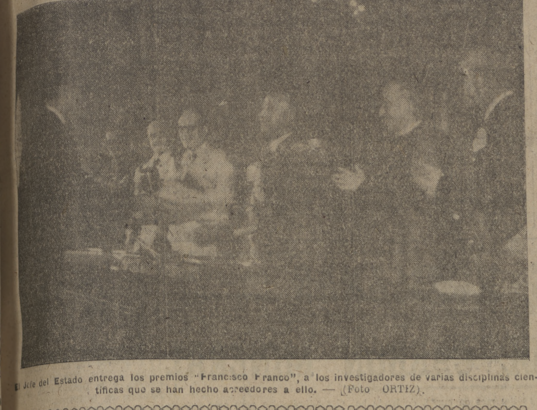
El jefe del Estado entrega los premios "Francisco Franco", a los investigadores de varias disciplinas científicas que se han hecho acreedores a ellos.