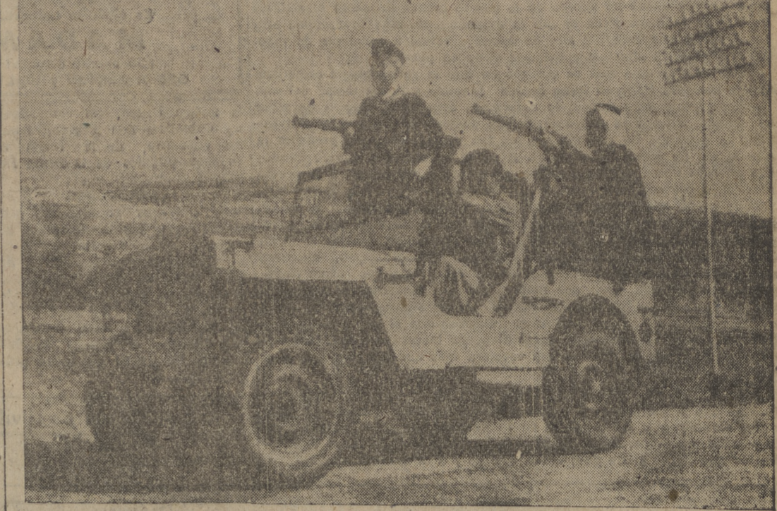
Miembros de una patrulla armada árabe vigilan fuertemente pertrechados y desde un "Jeep", un acceso a un barrio judío entre Nabius y Jerusalem.