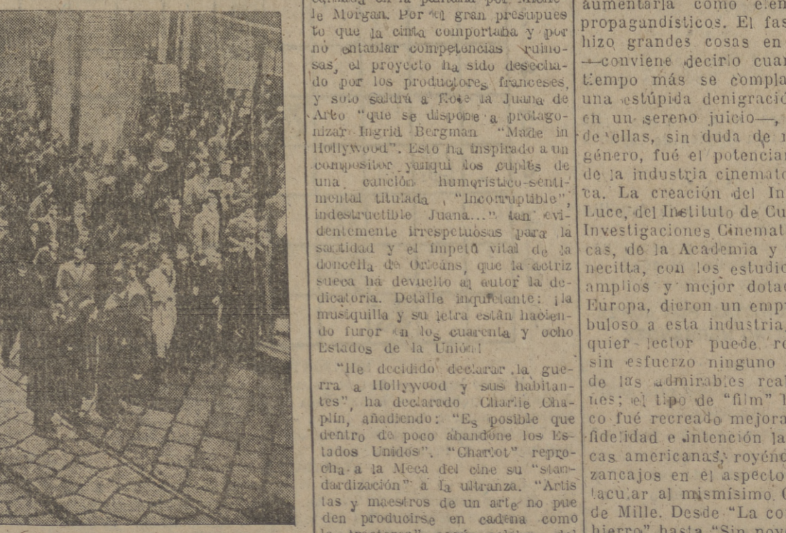
Un aspecto de la imponente manifestación de obreros parados en el Ruhr, en petición de trabajo. Tropas del Ejército y de la Policía tuvieron que acudir con urgencia a proteger los edificios públicos, en previsión de posibles disturbios.

UNA IMPRENTA SECRETA Sólo tres empleados conocen la imprenta y los tres son generales. Su director es el general Vandenberg, jefe que fué del Servicio Secreto norteamericano durante la guerra. Es probablemente el único director de periódico que sea al mismo tiempo general y periodista.