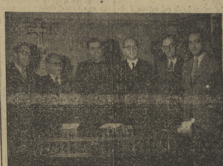
El ministro, durante la ampliación de la referencia del Consejo.

Mejora de derechos pasivos para los familiares de los muertos, pensiones para las familias de obreros, accidentes del trabajo, reconstrucción de edificios oficiales, concesiones de crédito para los de carácter particular, construcción de viviendas, para obreros, trabajo para los mismos, mercaderías, aplicación del seguro catástrofe y todas cuantas previsiones y remedios han sido estudiados por el Gobierno, están ya en