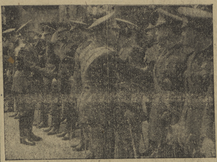
El Caudillo, saludando a los jefes y oficiales de la guarnición.

Después de haber permanecido dos días entre nosotros, Burgos ha despedido al Caudillo con gran afecto y entusiasmo. A las 11 de la mañana quedó paralizada completamente la vida ciudadana; y en verdadero alboroto se dirigieron las gentes hacia la plaza de Castilla y el paseo de la Isla, para exteriorizar a Franco su simpatía y adhesión. De todas las fábricas y empresas de trabajo acudieron los obreros y las obreras, con sus correspondientes guiones y presididas por los patronos, para vitorear al salvador de España, situándose en primera fila en los paseos de la plaza de Castilla y en el puente de Castilla y extendiéndose la multitud hasta la carretera de Valladolid, por donde el Caudillo había de salir de la capital.