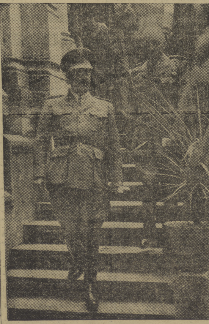
El Caudillo desciende de su Residencia momentos antes de abandonar nuestra ciudad.

Trata, finalmente, de la Organización de las Naciones Unidas, y dice: "Gran parte de la Organización de las Naciones Unidas funciona bien. La parte que más deprecia es la del Consejo de Seguridad. Se va convirtiendo en gran parte en una exhibición de propaganda. Los vetos se están aplicando en forma absolutamente estúpida."