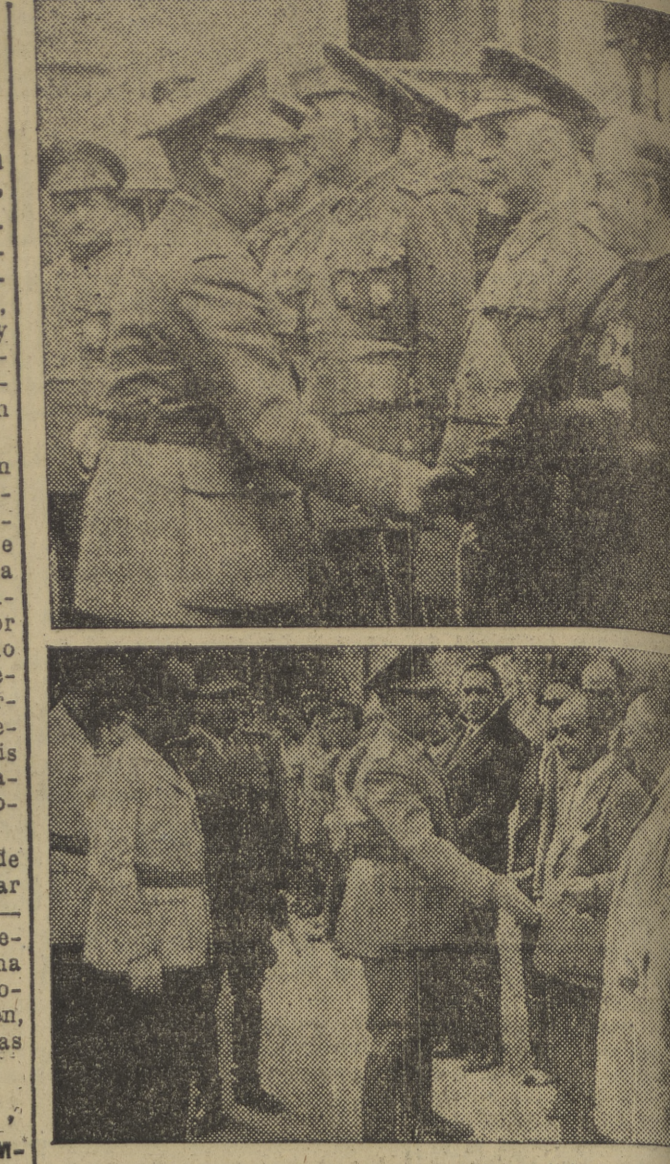
En el Parque del Palacio de la Isla, el Generalísimo da la bienvenida a las personas que han acudido a despedirle. (Foto Villafraanca).

El ministro de Educación, durante su visita al Orfeón Buralgalés. (Foto Villafraanca).