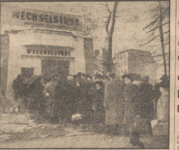
El rumor de que el marco de Alemania Oriental iba a ser desvalorizado ha motivado la formación de "colas" ante los establecimientos donde se cambian estos marcos por dólares de ocupación. En la fotografía, una de estas colas en Berlín Occidental.