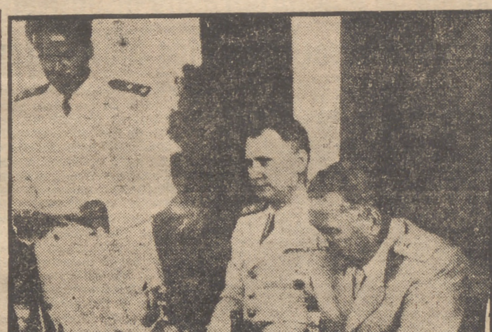
Tito, el "comunista aburguesado", como le llaman los de la Kominform, está cabizbajo. Los manjares, a los que se muestra tan aficionado, no le seducen en esta ocasión. ¿Piensa en los ejercicios de los satélites?