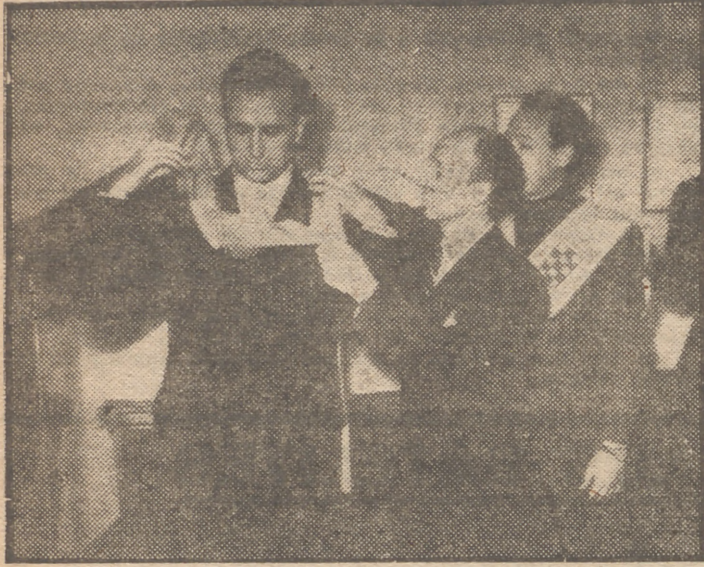
Momento de la imposición de la beca de colegial honorario del Colegio Mayor "Alejandro Salazar" al ministro de Educación Nacional, señor Ruiz Jiménez, en acto celebrado en el Hogar del S. E. U. de Valencia.

A mediodía asiste a la inauguración del Colegio Mayor Universitario Ruiz de Alda, del S. E. U.