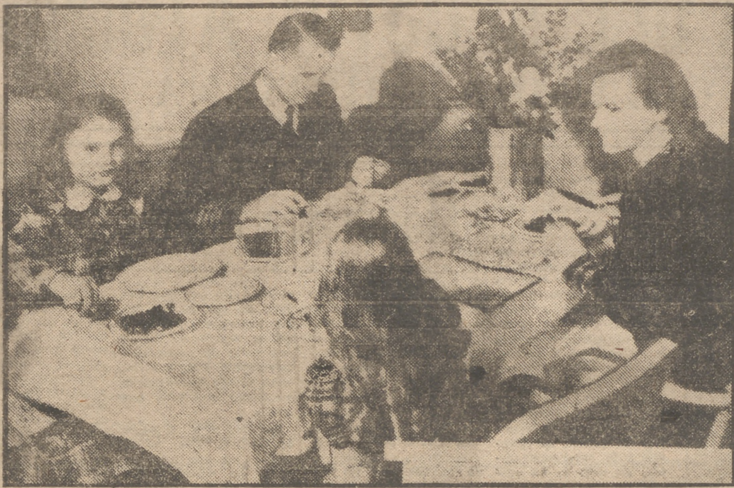
El capitán Carlсен, héroe del "Flying Enterprise", con su esposa y sus hijas: Sonja, de once años, y Karen, de siete (de espaldas a la cámara). La fotografía está tomada antes de la hazaña del "Flying".

Su recepción será la más calurosa después de la que se le tributó a Mac Arthur Le será impuesta la medalla de la ciudad