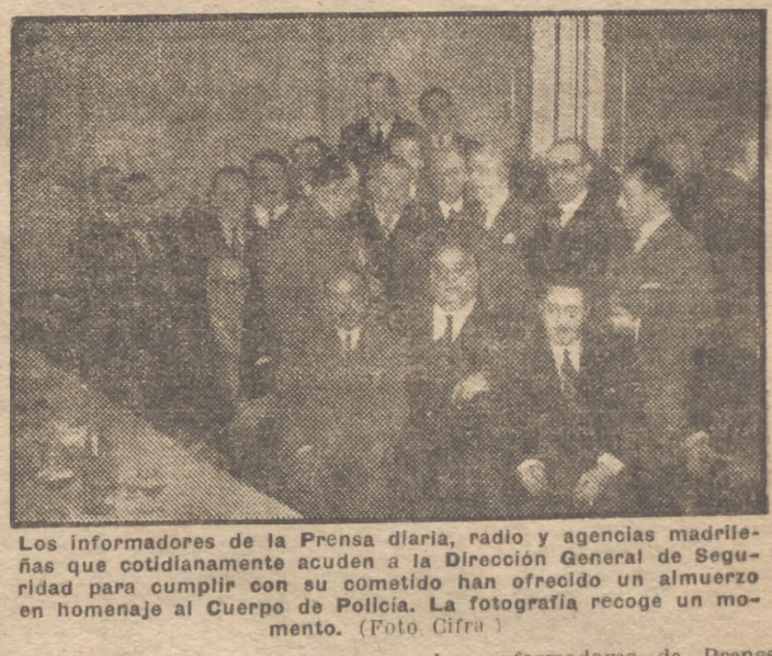
Los informadores de la Prensa diaria, radio y agencias madrileñas que cotidianamente acuden a la Dirección General de Seguridad para cumplir con su cometido han ofrecido un almuerzo en homenaje al Cuerpo de Policía. La fotografía recoge un momento.