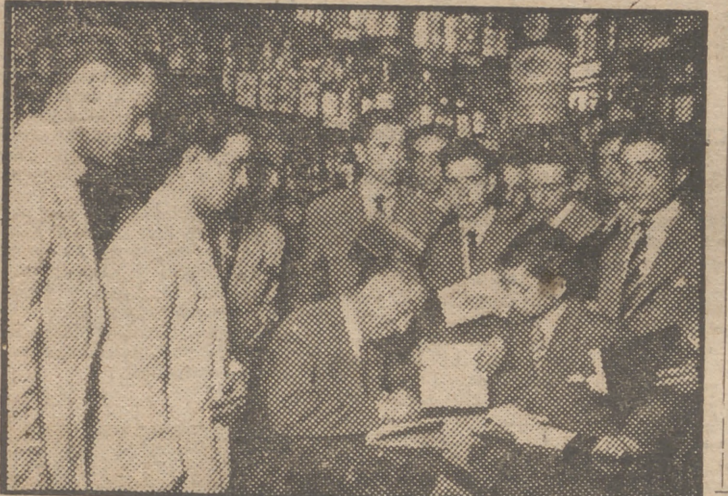
Los alumnos de la Escuela de Hostelería de Sevilla, que se encuentran en viaje de estudios en Madrid, han visitado el Museo de bebidas de Chicote, y el popular barman les está firmando unos autógrafos.