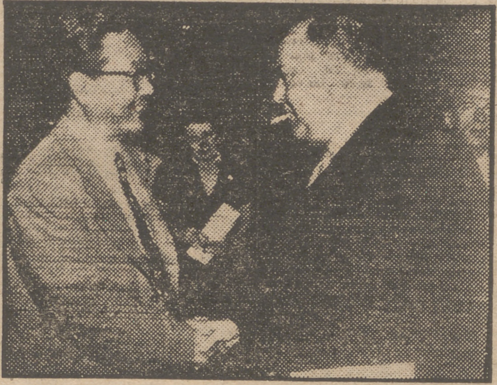
El Consejo de Seguridad de las Naciones Unidas se reunió el día 25 de este mes para deliberar sobre el conflicto de Corea. En la foto (izquierda), el embajador de Corea, John Myun Chang, saludando a Trygve Lie durante la reunión del Consejo de Seguridad.

Informes: Bares, cafés, manjares, etc., y Dos Hermanas, 13. Teléfono 27 12 12 "Moriles 47, que anima y rejuvenece"