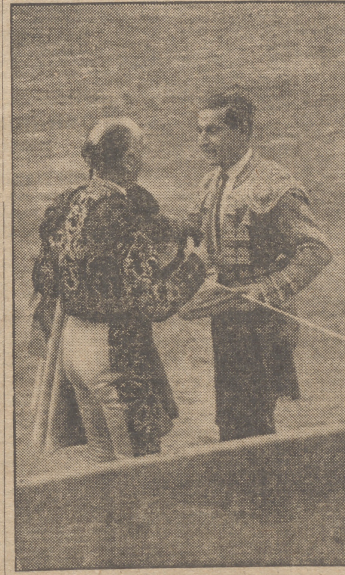
Antonio Bienvenida, torero de alcurnia, elegante, genial, caballeroso, en cuya cuadrilla figuraba Luis Suárez (Magritas) como subalterno, tuvo la gentileza de brindarle el último toro que a sus órdenes banderilleaba y lidiaba el gran peón en la Plaza de Madrid, Antonio, que tuvo una brillante actuación, rubricaba así una historia torera ejemplar, llena de virtudes artísticas y profesionales de las que la casa Bienvenida puede enorgullecerse de poseer

disgresiones, reuía en el coraje que puso al matar a su difícil enemigo resabado a capotazos al quitar en su otro turno por gaoneras, jugándose el tipo con rabia de principiante. Día melancólico para Ortega y el orteguismo. Quizá su adios—oreja en mano—como era definitivo el de don Luis Magritas, las parejas de sus rehiletes clavados juntos sin que un solo palo cayese, pausado el citar, y ganando la cara a los incómodos enemigos, y en ella frente al testuz, el suave levantar de manos, el templado reanular y el picotazo certero, sobrado e diestro de terreno y salida y los arpones en el hoyo de "la mataera". Ovaciones, saludos, brindis y abrazos de los maestros eran el homenaje a una limpia historia de artista y de hombre. Se encendieron las luces. El sofoco de la tarde veraniega cedía con el anochecer. Nadie se iba de la Plaza y así fué clamorosa la ovación a Magritas cuando a hombros, como el Litri, abraza-