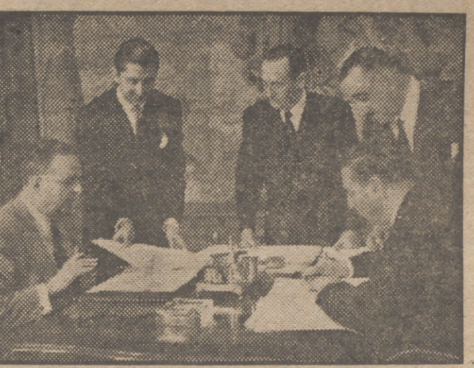
El ministro de Asuntos Exteriores de España, señor Martín Artajo, y el encargado de Negocios de Cuba firman en el Palacio de Santa Cruz el intercambio comercial y financiero entre ambos países.