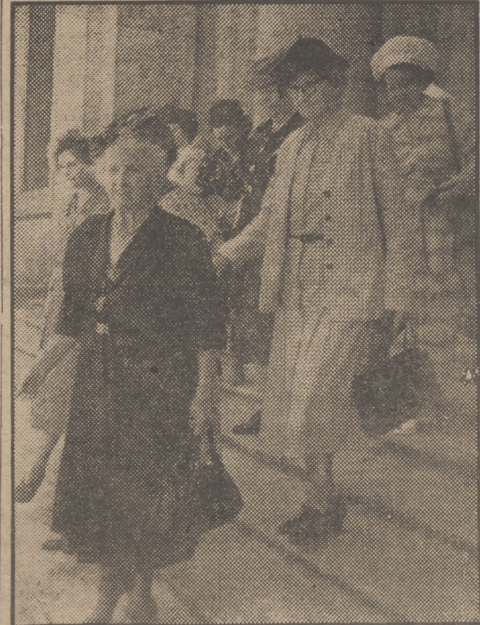
Las señoras abogadas norteamericanas que se encuentran en Madrid han visitado hoy el Museo del Prado. Vemos aquí a las ilustres juristas al abandonar nuestra pinacoteca nacional.

HA LLEGADO A MADRID UNA IMPORTANTE REPRESENTACION