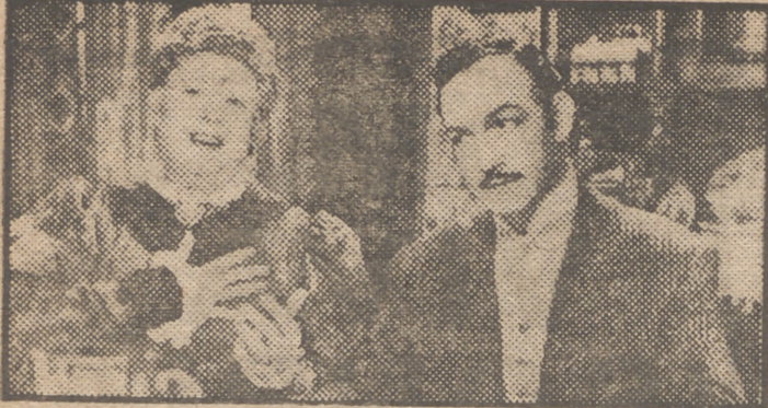
Julia Lajos y el popular cantor mejicano Jorge Negrete, en un plano de "Teatro Apolo", la nueva superproducción de Cesáreo González, actualmente en rodaje en los estudios CEA bajo la dirección de Rafael Gil