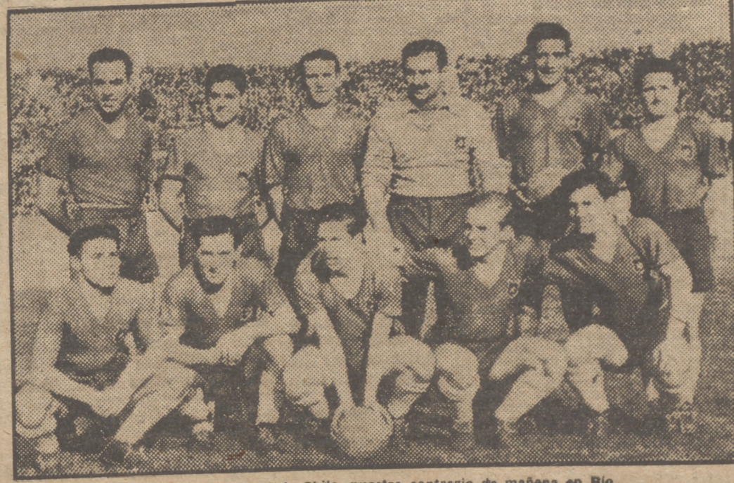
El equipo nacional de Chile, nuestro contrario de mañana en Rio

Y ocupémonos de este choque Chile-Inglaterra, por cuanto puede interesarnos. No hemos de ver en el resultado del partido una buena actuación de nuestros contrarios de mañana. Hagamos otra reflexión más de acuerdo, a nuestro entender, de cuanto pasó en dicho partido: la de que Inglaterra no quiso ni necesitó esforzarse en ningún momento para vencer a sus enemigos. Así las cosas, España puede y debe ganar mañana a Chile. Y puede y debe ganar sin los apuros que pasó para batir a los Estados Unidos. Si así lo logra, se llegará a un encuentro decisivo con Inglaterra el domingo. Y... de ese encuentro habrá tiempo para hablar... J. L. M.