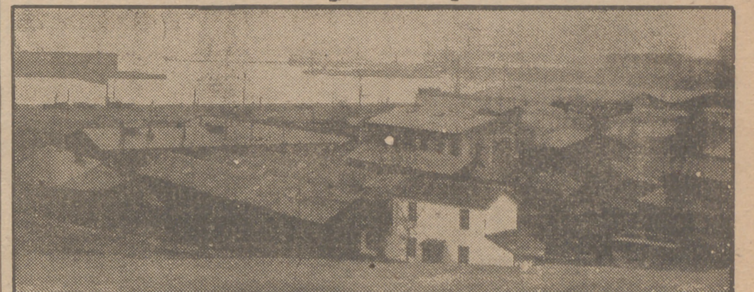
Constanza es un puerto rumano a las orillas del mar Negro. A hora la vida plácida de sus pescadores y labradores se ha visto inquietada por la presencia de las armas de un numeroso ejército ruso de ocupación. Con los soldados soviéticos han llegado multitud de familias que han aumentado las dificultades ya existentes.