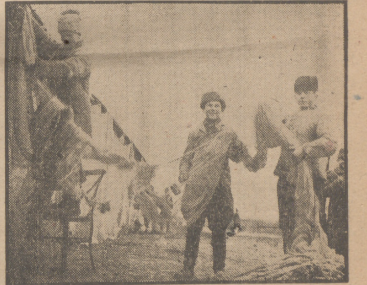
Unos pescadores de Constanza, única salida de Rumania al mar Negro, extienden sus redes para secarlas tras el trabajo.