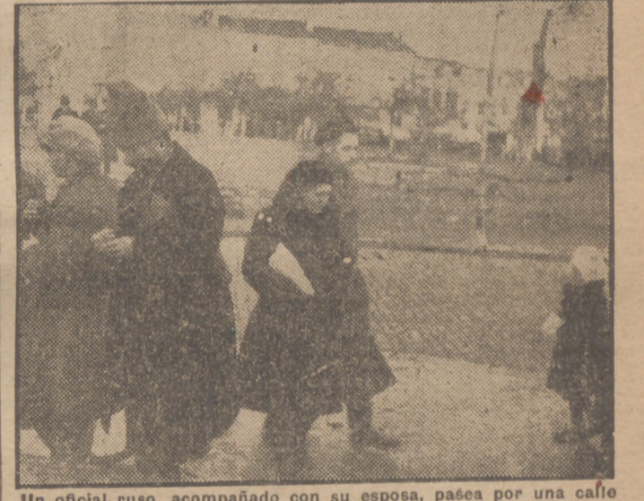
Un oficial ruso, acompañado con su esposa, pasea por una calle de Constanza.