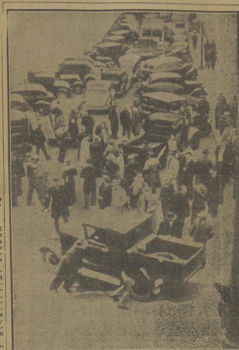
Aspecto que ofrecía la avenida principal de acceso a una fábrica norteamericana momentos después de declararse en huelga los obreros de la industria del automóvil. La totalidad de los vehículos pertenecientes a los empleados de la fábrica y los dedicados a transporte de los productos de la misma fueron acumulados para intercepción al paso durante el tiempo que dura la huelga.

LONDRES 14.—Pocos minutos después de haberse iniciado esta mañana la reunión de la asamblea de la O. N. U., el primer ministro neozelandés, Peter Fraser, ha retirado la candidatura de su país para el Consejo Social y Económico, dejándole así el camino libre a Yugoslavia. La asamblea de la O. N. U. ha elegido a Yugoslavia como miembro del Consejo Social y Económico por 45 votos. (Efe.)