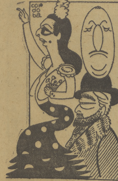
Celia Gámez, Pepe Isbert y Casaravilla.