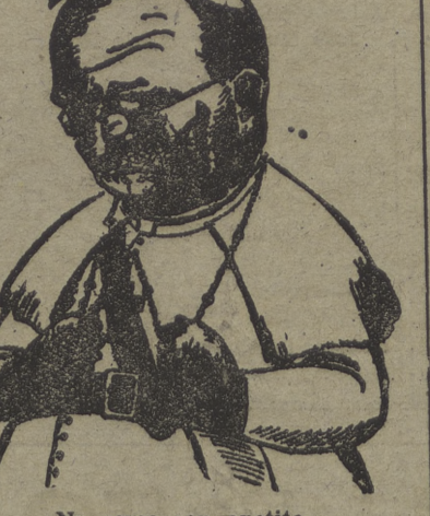
No come con apetito...