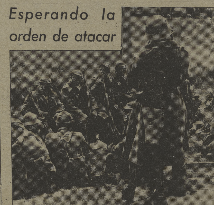
Cada día, cada hora, los milicianos obreros se lanzan a ataques parciales, de gran eficacia, en todos los sectores del frente de Madrid...