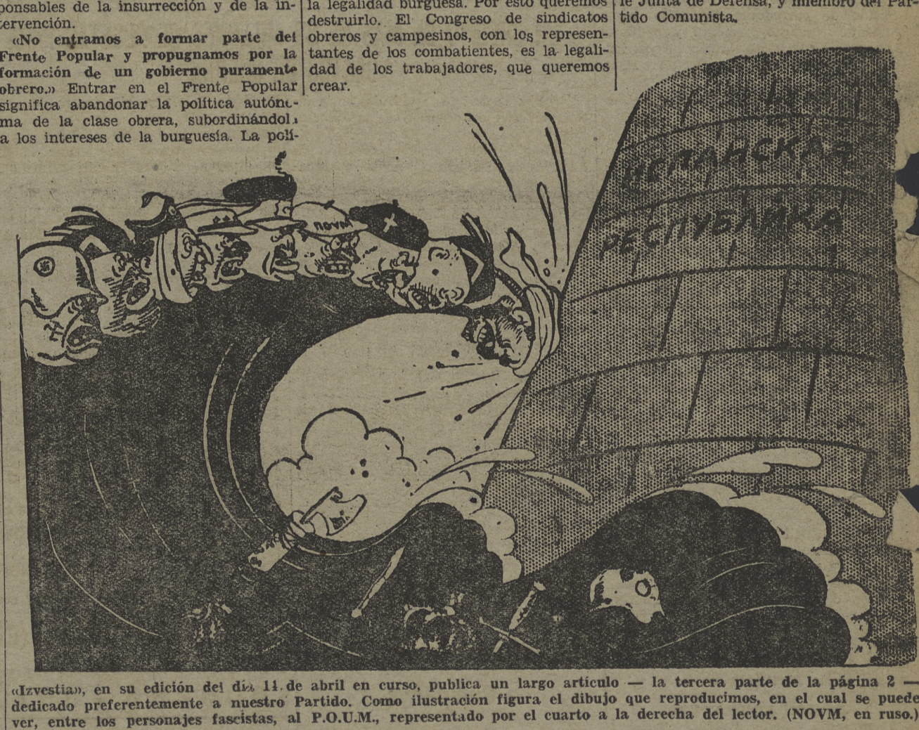
'Izvestia', en su edición del día 14 de abril en curso, publica un largo artículo... dedicado preferentemente a nuestro Partido.